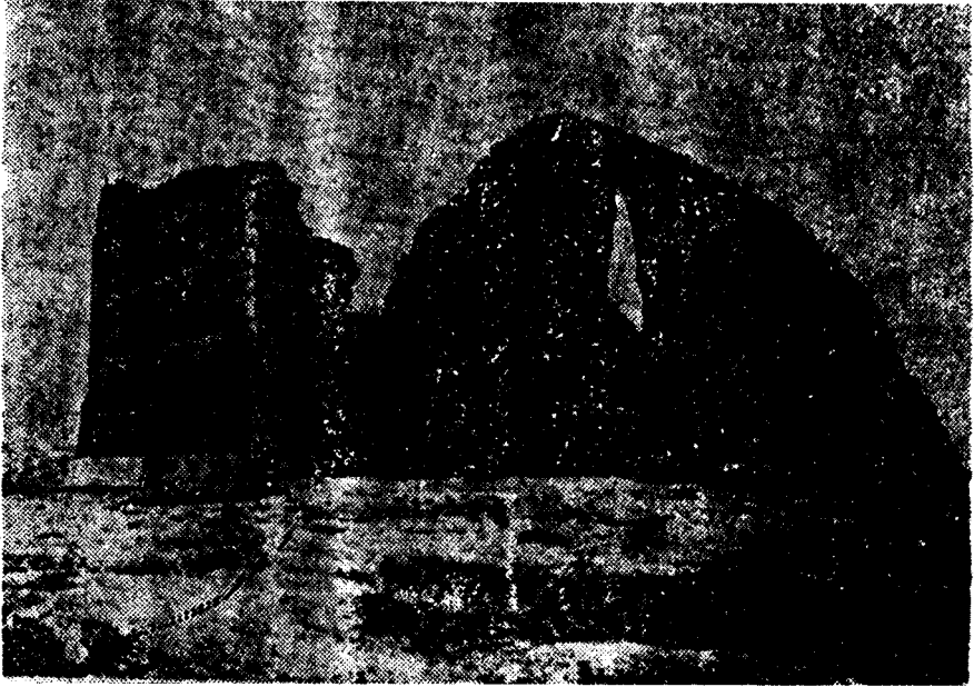
«طاق كسرى أحد قصور الساسانيين ولعل مشيده شابور الأول