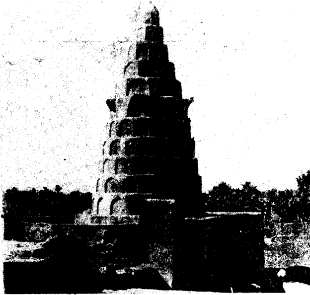
التصوير رقم ٢ مرقد حزقيال في الكفل

ووصف هذا القبر لوفتس (Loftus) في سنة ١٨٥٣ قال: «يقوم المزار من دارين معقودتي السقف. فسقف الدار الخارجية يستند إلى أعمدة ضخمة، أما المزار فهو صندوق كبير وقديم الأيام طوله عشر أقدام وارتفاعه أربع أقدام ومزين بشيت إنكليزي وبعض أعلام حمراء وخضراء ويزين السقف المعقود أدراج ذهب وفضة وفلذ وقد بني في إحدى زواياه أسفار موسى الخمسة بالعبرية ويظن أن حزقيال النبي كتبها بيده. وهناك قنديل موقد ليلاً ونهاراً ويقال إن حزقيال بنفسه أوقد ذلك القنديل وبقي على تلك الحال منذ ذلك العهد ويغرون الزيت والفتائل كلما دعت الحاجة إليه» (غنيمة ص ١٩٩ - ٢٠٠).