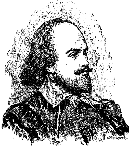
وليام شيكسبير الشاعر الروائي الانجليزي الديمقراطي ولد سنة ١٥٦٤ وقضى سنة ١٦١٦