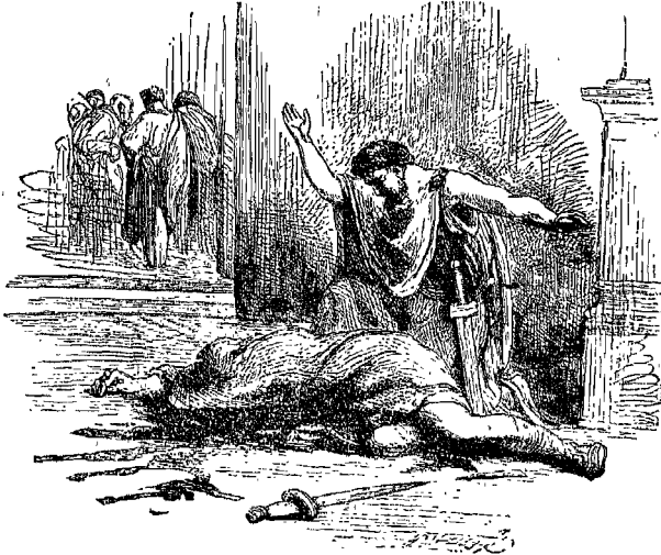
« واقصره رب الرفعة والجلال . . . »

ففى فيها قيصر وليست سيوف أتمنى أن تجهز علىّ الا تلك التى تخضبت بأظهر الدماء انى استحلّكم بجميع الأيمان ان كان فى نيتكم قتلى أن تنفذوه حالا اذ لو عشت ألف سنة مما تمردون فلن أجد لحظة فيها أتمنى الموت أطيب من هذه ولا بقعة يلدلى للنّام فيها أروح من هذه ولا وسيلة أموت بها أشرف من هذه أن أكون بجانب قيصر وأن أفضى بأيديكم أنتم أنتم جود الأيام على الأنام بروتاس : يا أنتونى لا تطلب موتك منا فاننا ان ظهرنا الآن بمظهر الجنّة القتلة كما يرى من أيدينا وهذه القمّة فان قلوبنا تقطر أسى وأسفاً أنت لا ترى الا أيدياً جانية ولكن اذا كشف لك عن قلوبنا وجدتها تسيل حزناً وشجناً وجدتها كثيفة نكدة لما أصاب رومه من الظلم والاحجاف النار تلتهم النار والرأفة تذهب بالرأفة ولذا فعلنا هذه القمّة وأما أنت يا أنتونى فسيوفنا عليك كيلة وسواعدنا قبلك هامة لا نشرها عليك لا بحقد ولا بضغينة وقلوبنا انما تستقبلك بالحبة والاخلاص