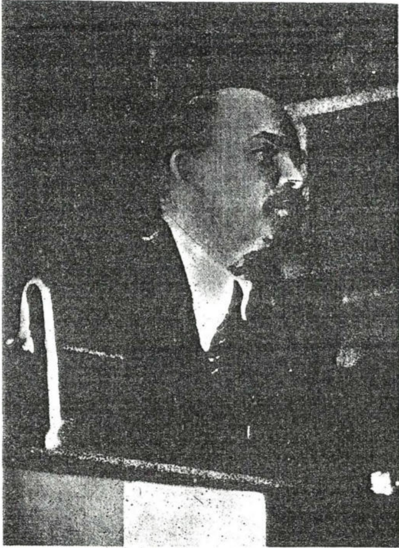
ليفتين نحن لا نؤمن بالله

والاغنياء بالفقراء، والرعوس الكبيرة بالرعوس الصغيرة.. ليصفو الامر في النهاية لفئة وطبقة جديدة تملك وتحكم وتستبد وتتسلط باسم الحزب والنظرية وتستمتع بما لم يستمتع به رأسمالي أو إقطاعي.. وقد صدقت عليهم كلمة «المعري»: