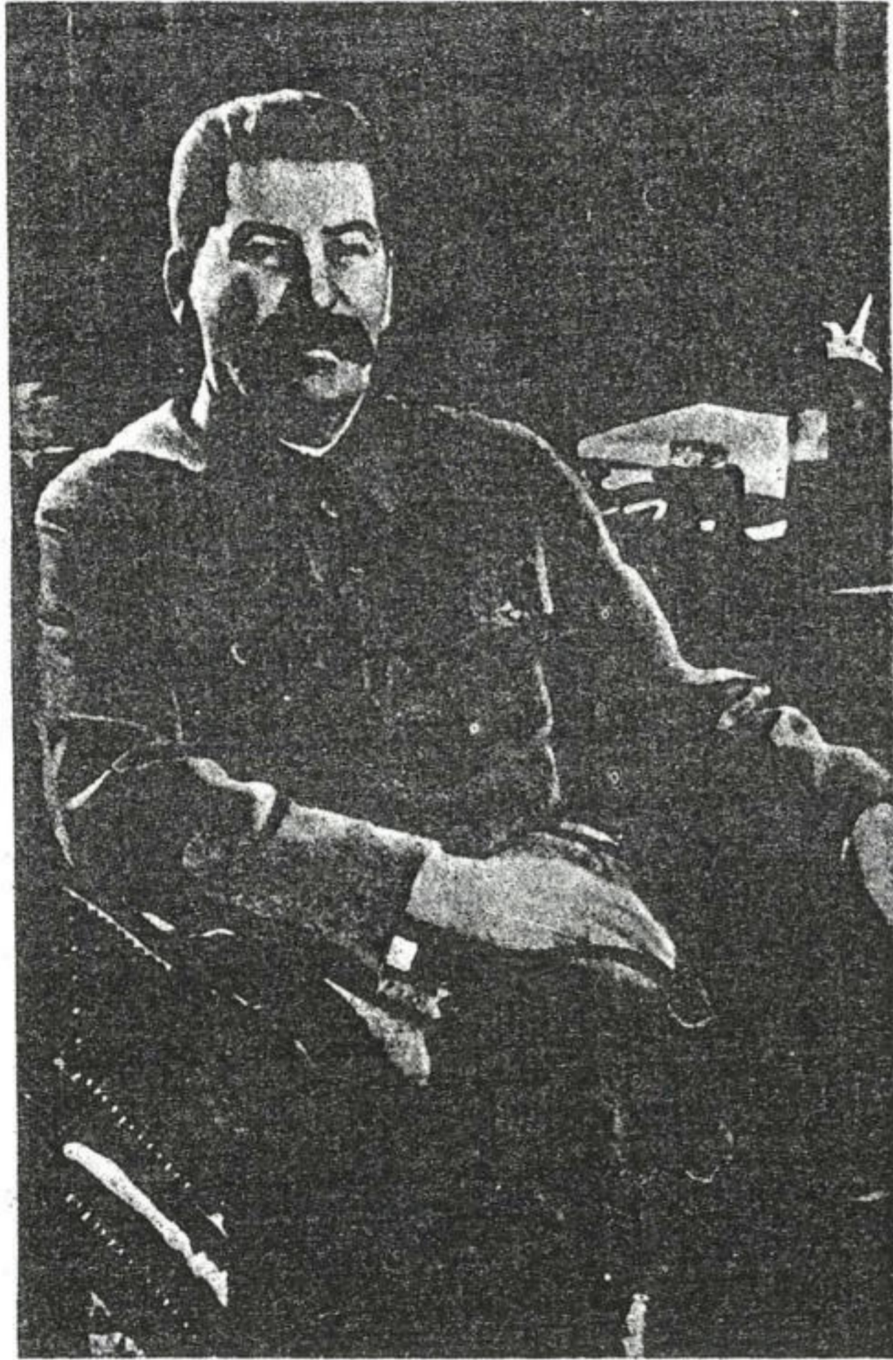
ستالين قتل الملايين في السجون

الفكر لم يخلق المادة وإنما المادة هي التي خلقت الفكر. إنجلز