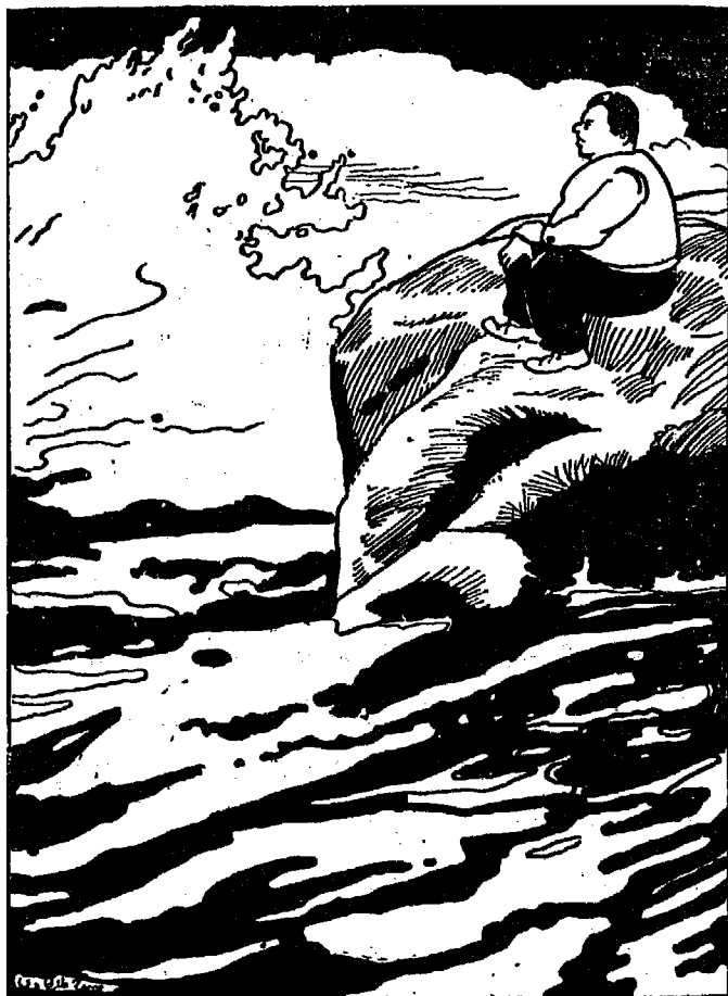
واكتفت من البحر بالنظر إلى موجه، والسبح في هوائه [ص ٨٨]