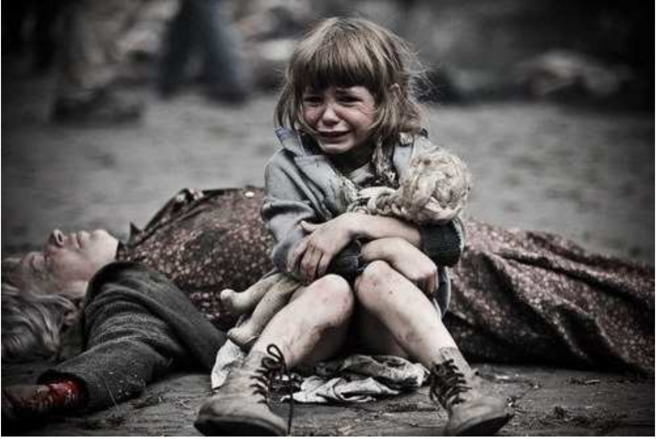
صورة تتحدث عن نفسها

عادت مسرعة من مدرستها مشتاقه لحضن جدتها وعروستها مشتاقه تحكى لها عن اصدقائها وعن امتحانها التي اجتازته بنجاح عادت لدفء حجرتها.. عادت ووجدت اشلاء واموات ووجدت ان الحياة قتلتها وهي على قيد الحياة وجدت عروستها حزينة مكسورة .. مشوه الملامح وجدتها طريحه على الارض لم تفهم ماذنب جدتها وعروستها في الحرب لم تكن تتمنى من الحياة سوى ان تحيا ان تجد لها بيت ومكان ان تعيش في وطن في امان لم تكن تعلم ماهى الحرب ولماذا يقتل الابرياء بدون ذنب لم تكن تعلم ان عروستها اذنبت لكى تموت هكذا