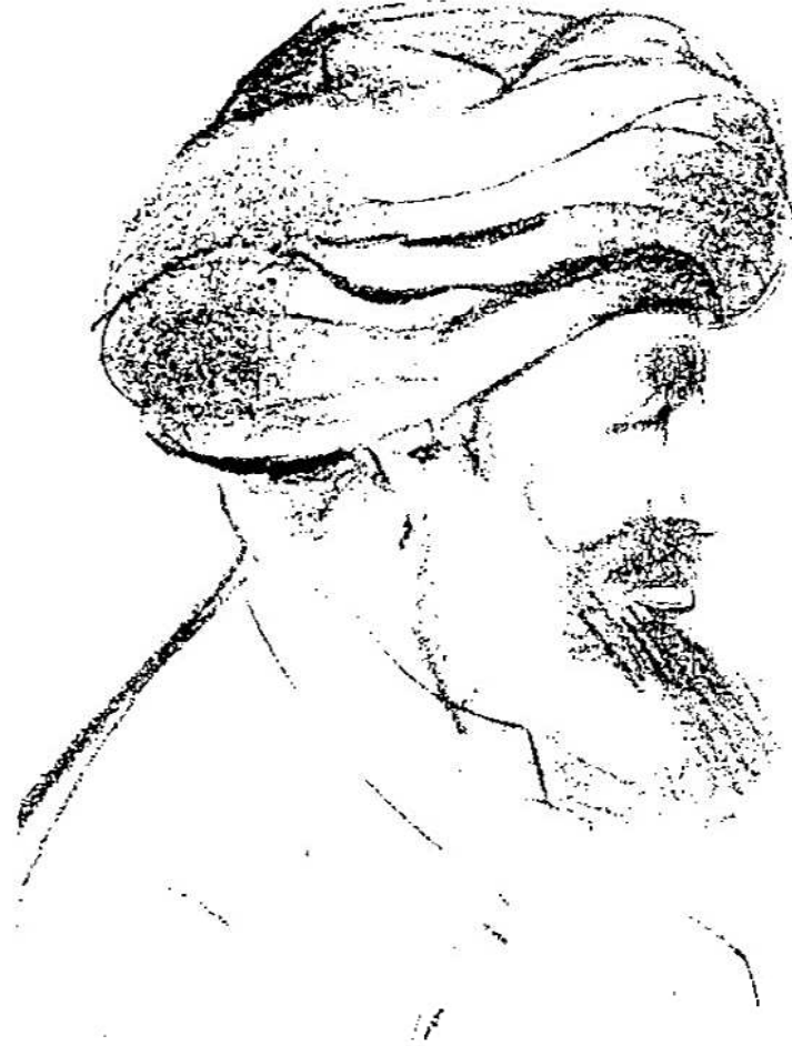
شكل رقم (١)

ديسيه . وقد هنا القائد الفرنسي على حسن بلائه وقدم إليه سيفاً تذكاريًا نقشت عليه « معركة عين القوصية - ٢٤ ديسمبر ١٧٩٨ » . وفي هذا الوقت كانت حدة القتال في الصعيد قد هدأت ، وساعدت الطبيعة الجغرافية للصعيد من احتوى به من المماليك على أن يجدوا ملاذا آمنا في كفورهم ونجوعه القابعة في بطون الجبل ، كما عاق ضيق الوادي المطررد نحو الجنوب أي تقدم فعال للقوات الفرنسية الزاحفة التي اكتفت بإقامة نقاط عسكرية فيما احتلت من أقاليم . ومن ثم طالت حملة الصعيد أكثر مما كان متوقعا .