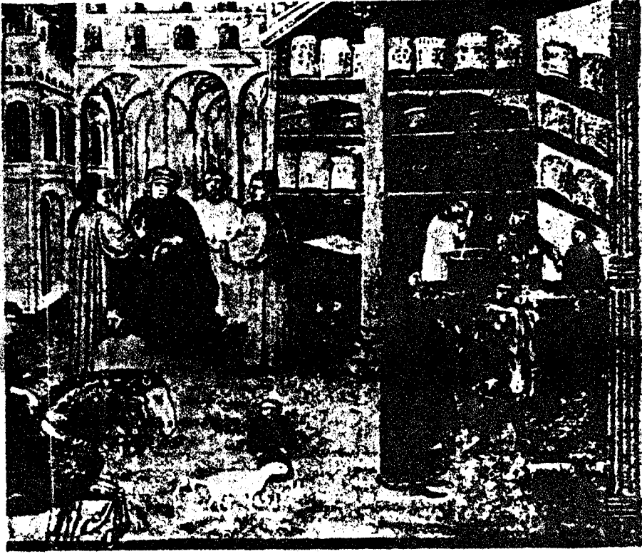
صيدلية عربية صيدلية عربية كما جاءت مخطوطة بالعربية لابن سينا