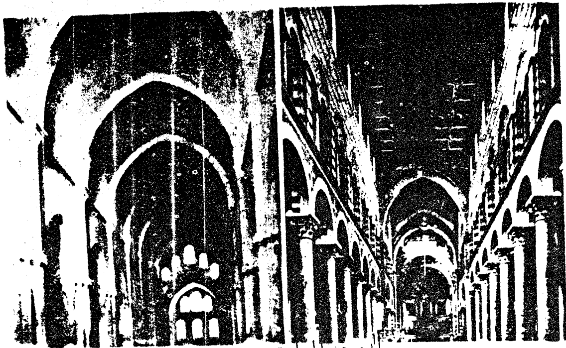
المرجح السابق مرة ٨ ٥٧

انتقل الطراز العربي في بناء المقود المنحنية الى اوروبة وتطور حتى اصبح عنصراً هاماً في فن البناء القوطي ( Gothic ) ، الصور من اليمين : ١ - تمثل لنا جانباً من هذه المقود في جامع « ابن طولون » بالقاهرة . ٢ - قبة موندريال بالقرب من بالرمو في النصف الاول من القرن الثاني عشر . ٣ - قبة « بيزا » وقد بدى . تشييدها عام ١٠٦٣ اي بعد الاستيلاء على « بالرمو » . ٤ - كنيسة دير فوتنناي Fontenay وقد بوشر في بنائها عام ١١٣٠ . ونرى الطراز العربي في بناء المقود المنحنية ، حتى في طراز الابواب ، كما يظهر في الرسم .