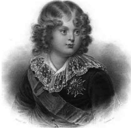
ابن نابليون — أو — ملك روما.

لصاحبها حصافة الرأي ورشد الحكم، بالرغم من كل نازلة مدلهمة وكارثة مداهمة.»