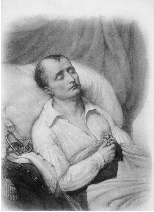
نابليون ميثاً وكفُّه على وسام اللجيون دونور الذي أنشأه.