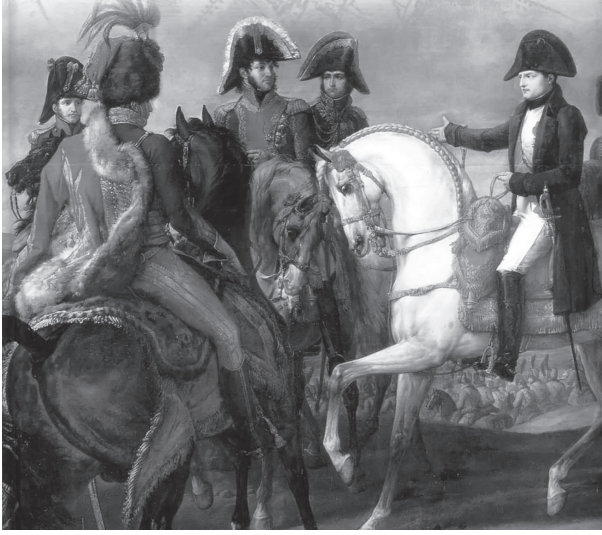
نابليون في واقعة أسترتلز.