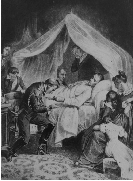
نابليون يقدم سيفه إلى صاحبه ويوصيه أن يسلمه إلى ولده.

«كلُّ يعمل لنفسه ويودُّ أن يرقى في الناس بالمين والوشاية، ولقد رأيت الناس في هذه الأيام أمشى بالدسائس وأسعى فيها منهم فيما مضى. فليت شعري، أفلا يقضي هذا على الأمناني والأمال! إنني لاشفق على أولئك الذين يقتادهم سوء الحظ إلى أن يمثلوا في الوجود دورًا ما كان أغناهم عن تمثيله. لئن عاش المرء في هدوء تحفُّه محبة أهل بيته له — إذا كان له أيها الأخ أربعة آلاف من الفرنكات — لقد كان له من أمره رشد. كما أنه يقتضي للمرء أن يكون بين الخامسة