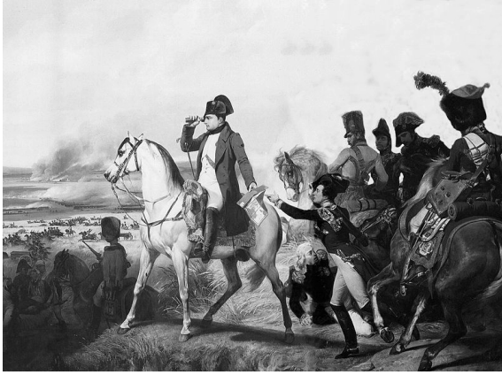
نابليون في واقعة واجرام.