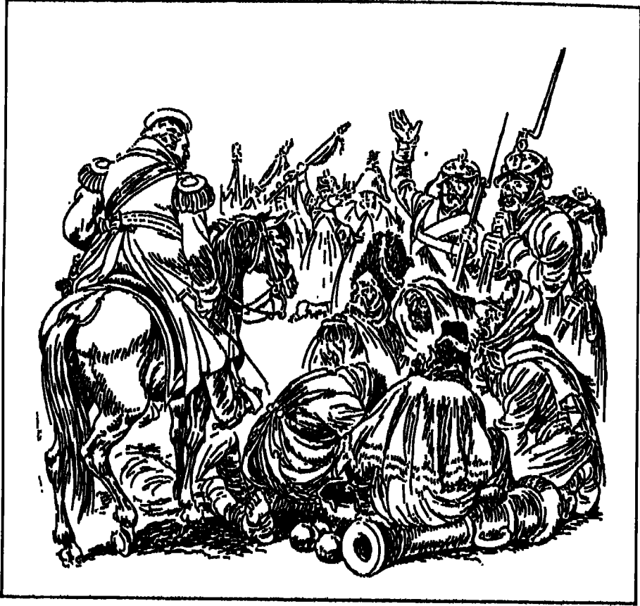
كوتوزوف يخطب في الجيش