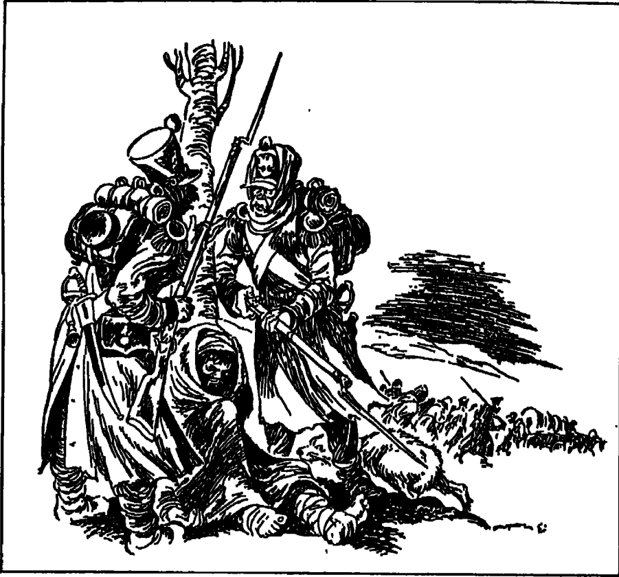
مقتل قائد الفصيل كاراتاييف.