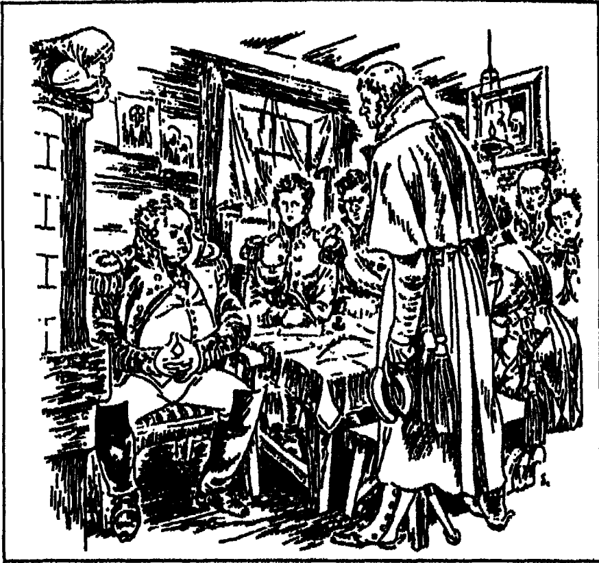
قنصل الحرب في ليبي .