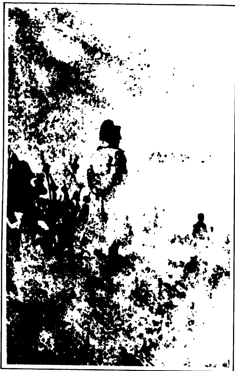
نابوليون قبل موسكو.