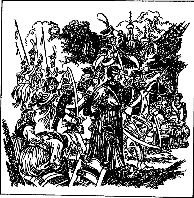
بطرس يساق أسيراً.