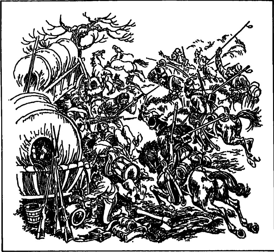
القوزاق تفاجيء جيش مورات.