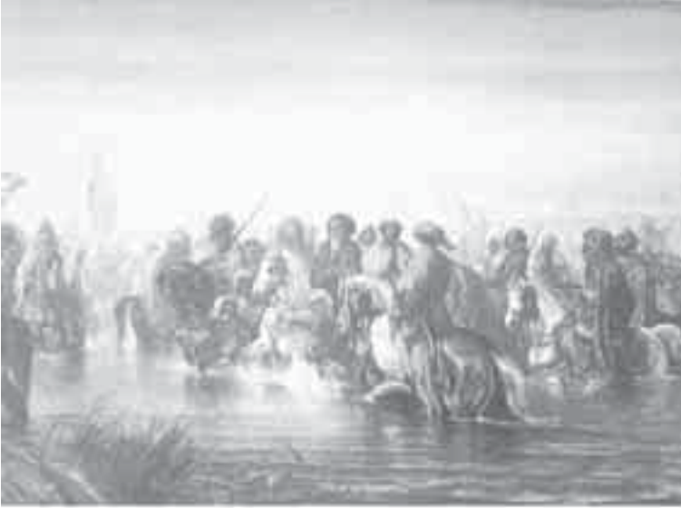
29- ديكان، فرسان أتراك يعبرون النهر.