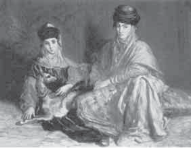
51- شاسريو، أم وابنتها من قسطنطينة تلاعب غزالة.