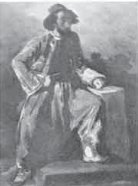
26- ديلاكروا, بورتريه باريوليه.