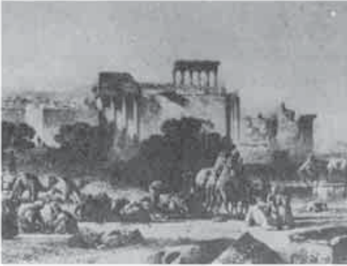
7- ماريلا: استراحة القافلة عند خرائب بعلبك.