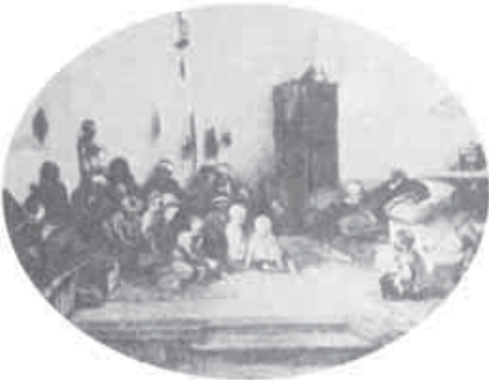
2- ديكان، مدرسة تركية.