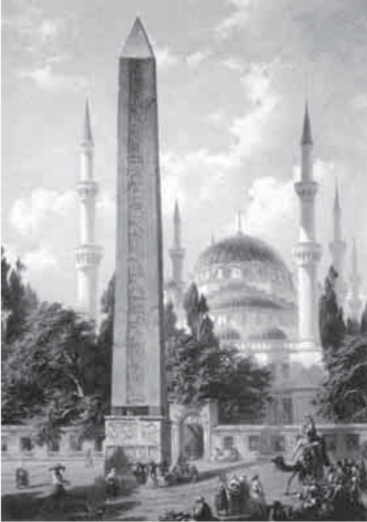
48- فلاندين و عامود هييون في القسطنطينية.