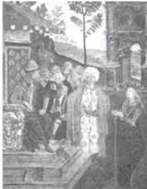
6- بنتوروكيو, تاريخ القديسة بريارة.