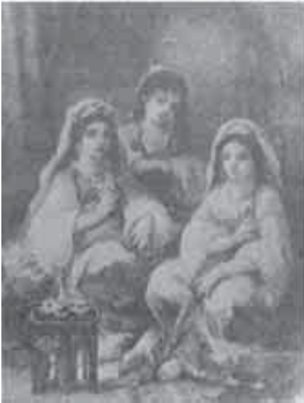
12 - ديازدي لاينا: نساء عربيات.