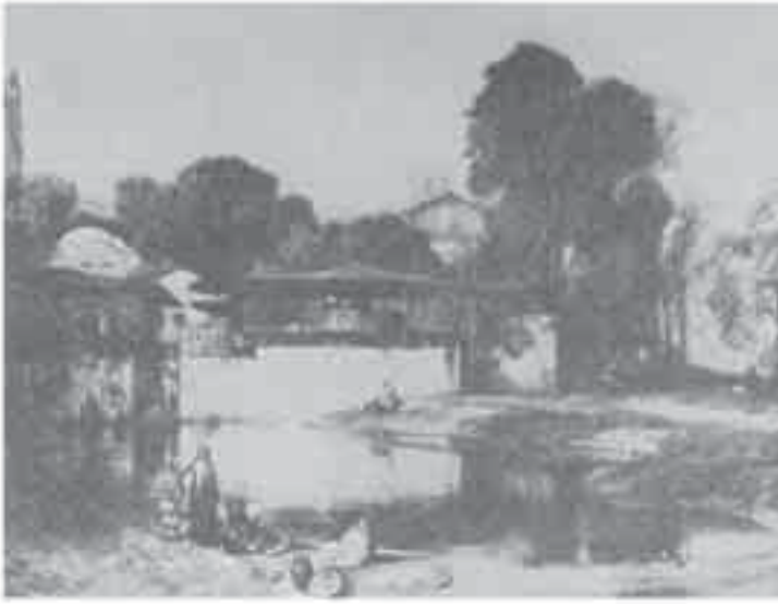
3- ديكان, منظر طبيعي تركي.