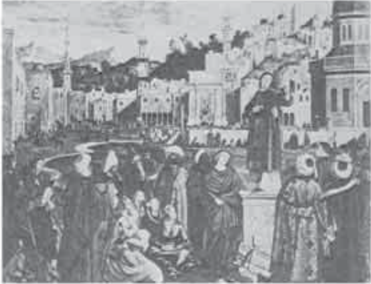
3- كاريكاتشو، تاريخ القديس اسطفان.