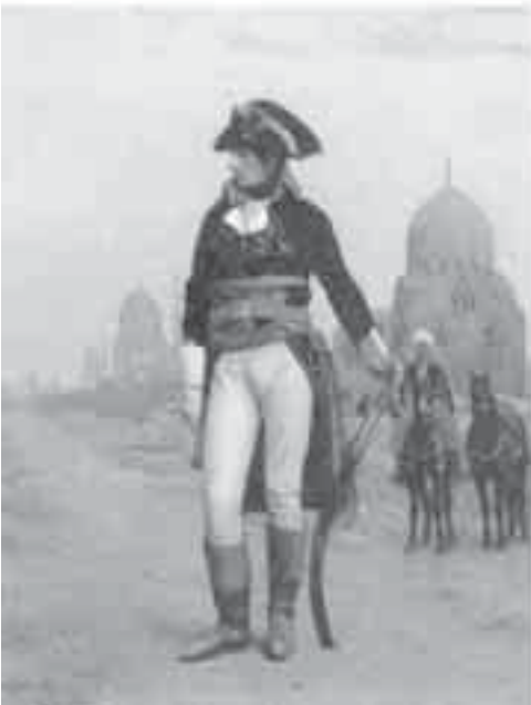
16- جيروم، بونابرت في مصر.