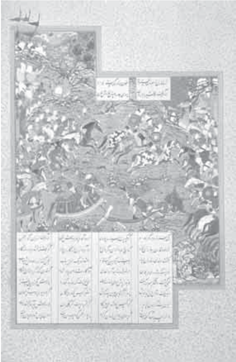
20- قارن يقاتل بارمان شاهنامه.