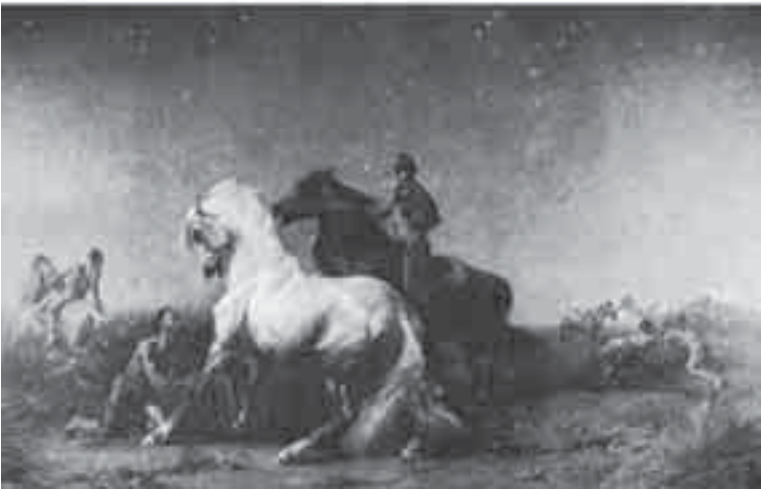
56- فرومنتان, حرامية الليل.