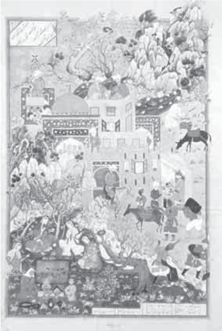
41- قصة هتفاد وتشرف.