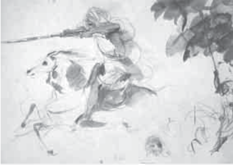
42- ديلاكروا, تخطيطات من دفتر المغرب.