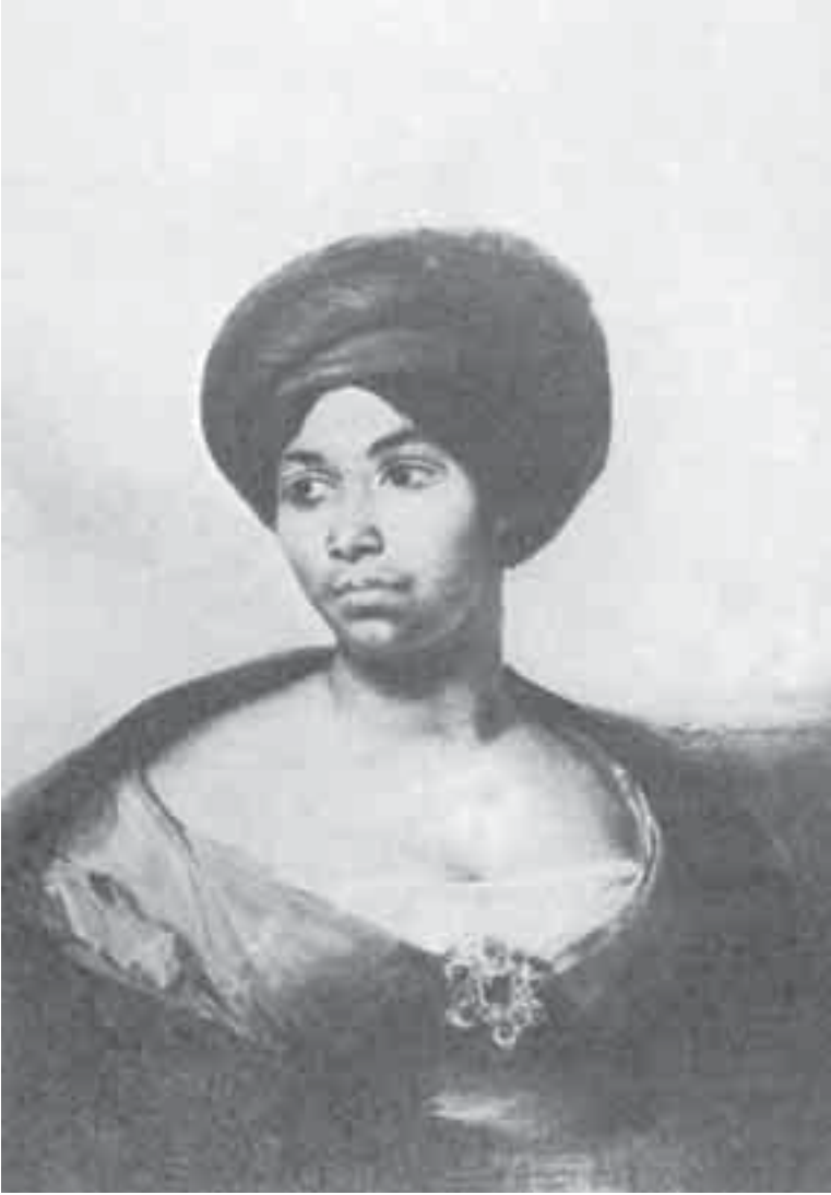
11- ديلاكروا امرأة بالعمامة الزرقاء.