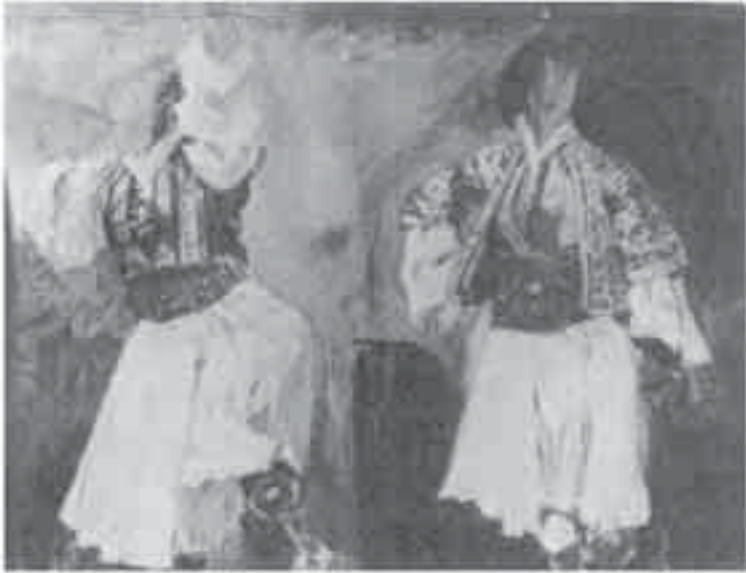
5- ديلاكروا، رسوم منسوخة عن ملابس شرقية.