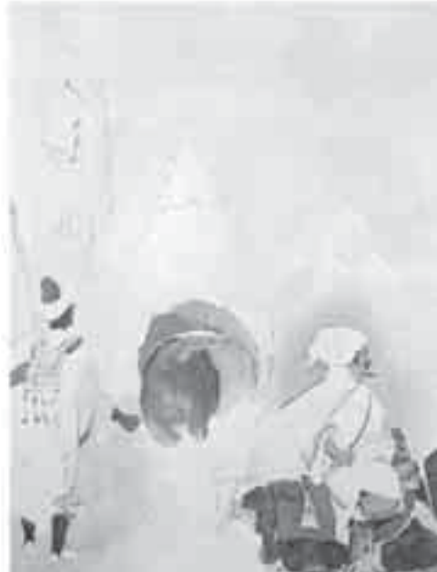
32- ديلاكروا، تخطيطات من دفتر المغرب.