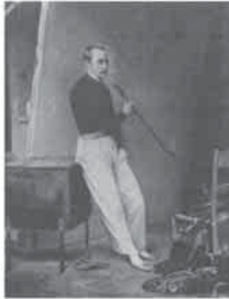
4- فرنيه, بورتريه شخصى للفنان بالزى الشرقي.