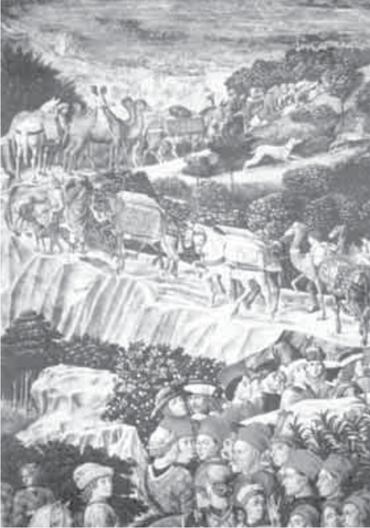
4- غوزولي، مشهد من سجد ملوك المجوس.