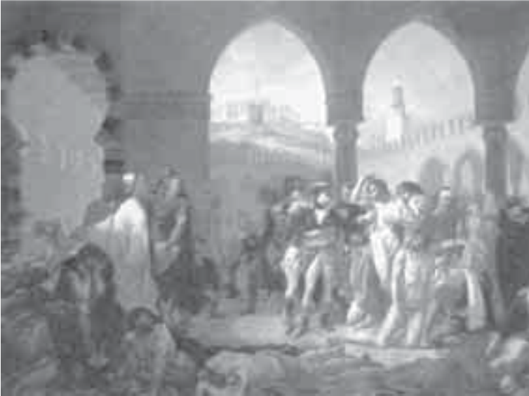
13- غرو، بونابرت يزور مرضى الطاعون في يافا.