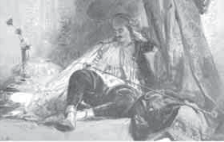
25- بونتغون, تركي في لحظة استجمام.