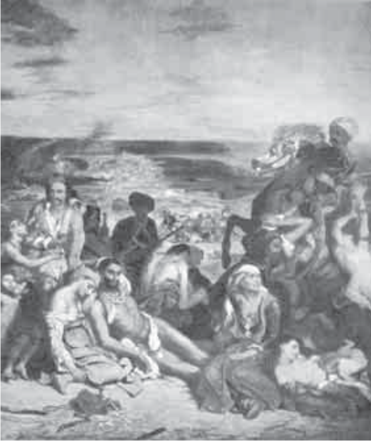
24- ديلاكروا، مذبحه هياوس.