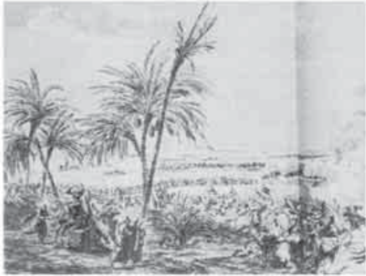
1- دينون، معركة أبو قير.