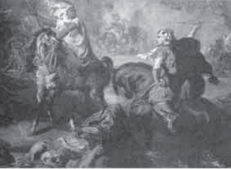
53- شاسريون الفرسان العرب في معركة.