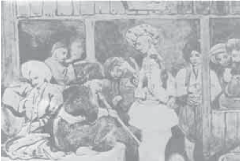
9- شارمتان، مقهى تركي.