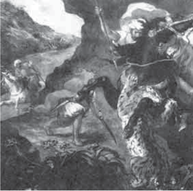
58- ديلاكروا, صيد النمر.