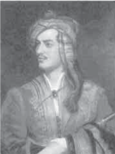
23- ديلاكروا، بورتريه بايرون بالزي الشرقي.