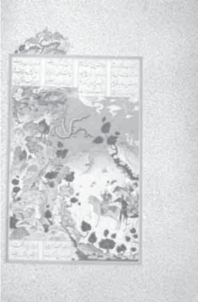
11- منمنمة إسلامية: رحلة مساما في جبل الدروز.