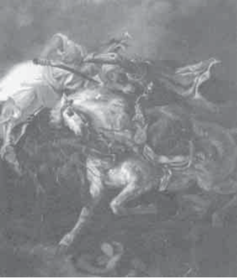
19- ديلاكروا، معركة بين فارسين.