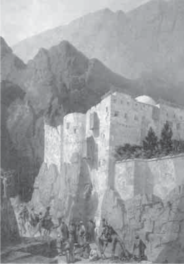
36- دوزا، القديسة كاترين في سيناء.