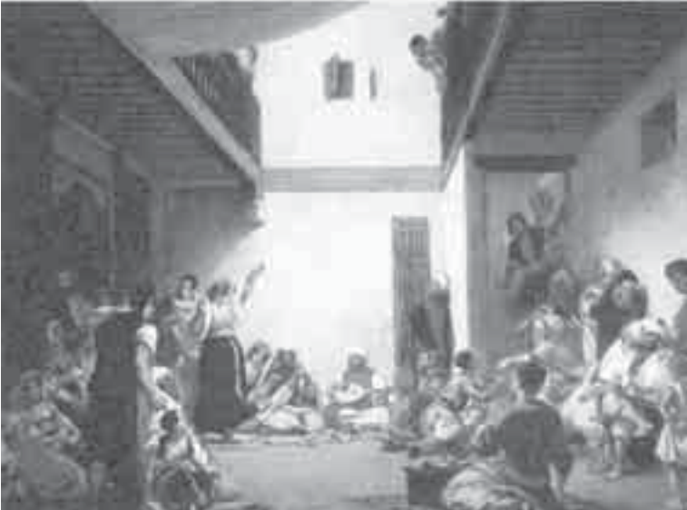
38- ديلاكروا، حفلة زفاف مغربي.