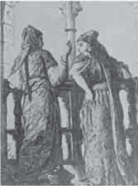
2- شاسريو، مغربيتان.