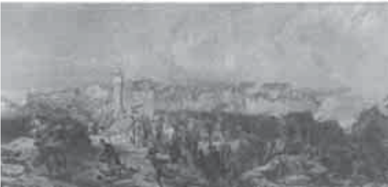
6- فرنيه: الاستيلاء على قسطنطينيه.