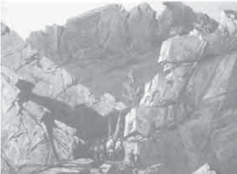
43- دوزا. منظر من الجزائر.