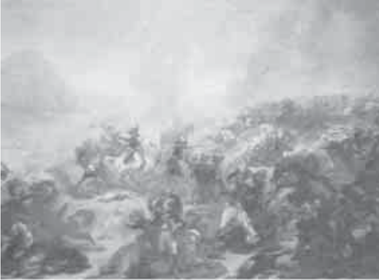
12- غرو، معركة الناصرة.