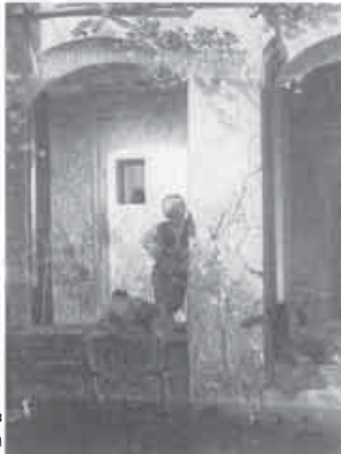
28- ديكان، أطفال أترك قرب النافورة.