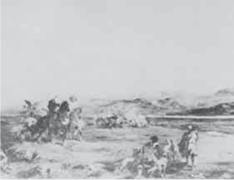
3- فرومنتان , صيد الإبل.