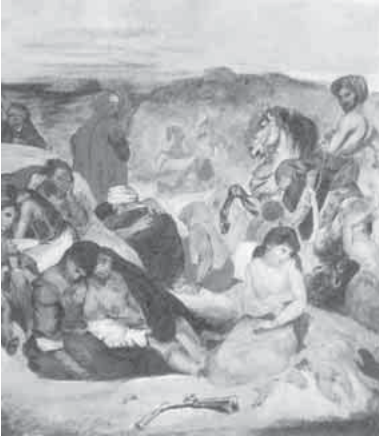
17- ديلاكروا, لوحة تمهيدية لمذبحة هيوس.