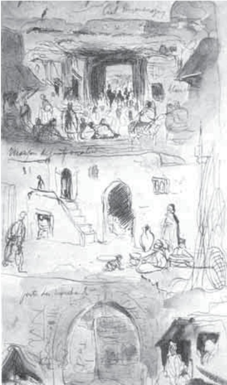
35- ديلاكروا، من دفتر المغرب.