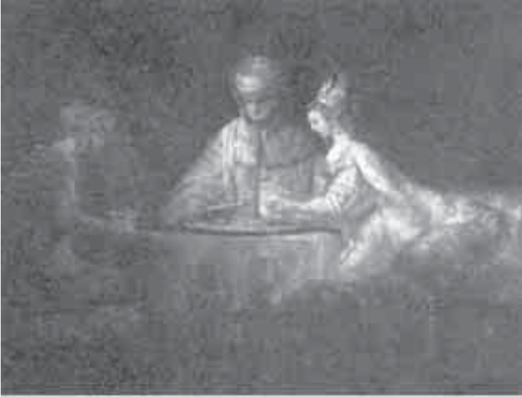
5- رمبرانت, أمان وأزفير.