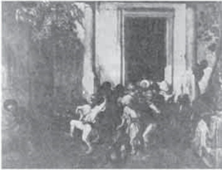
1- ديكان، الخروج من المدرسة التركية.