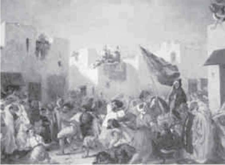
33- ديلاكروا، مشهد الجلد في تتحه.