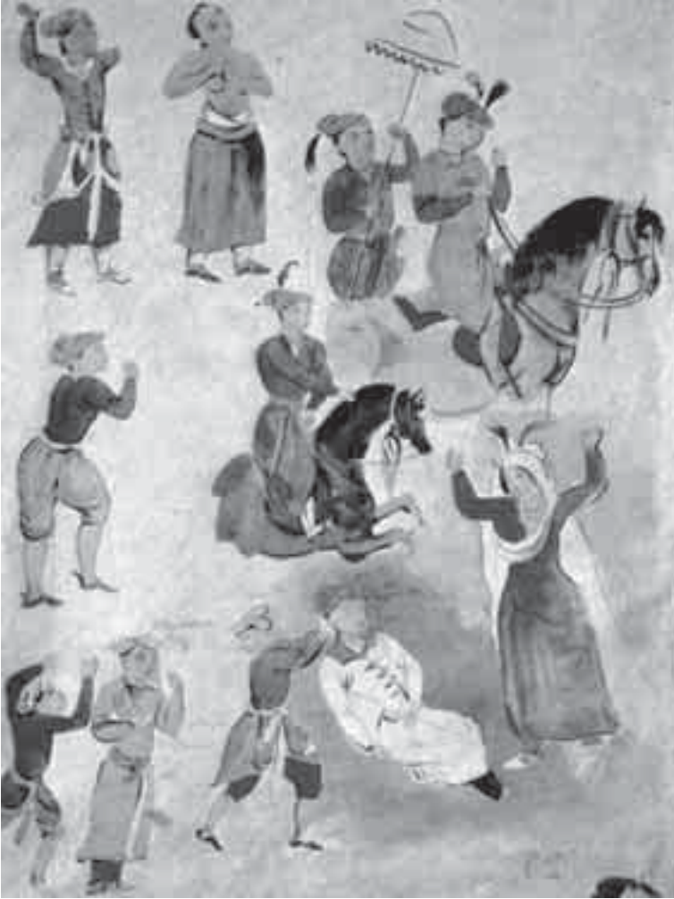
57- ديلاكروا, نسخ المنمنمات الإسلامية.