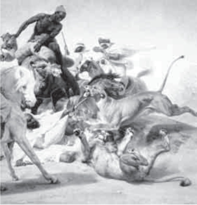
47- فرنیه، صید الأسود.