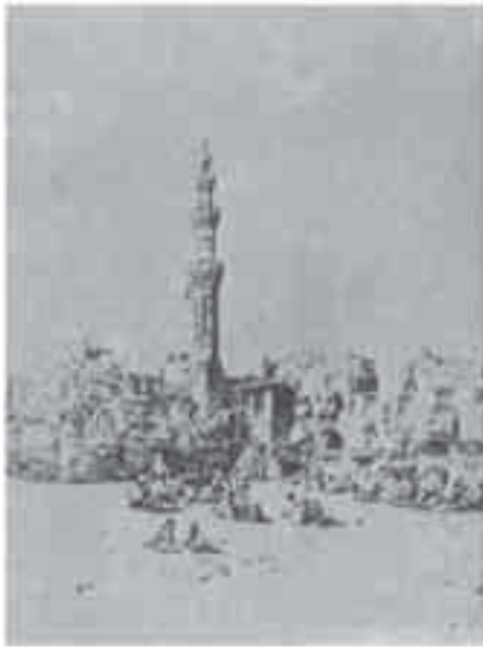
10- ماريلا: مشهد من ميدان بولاق.