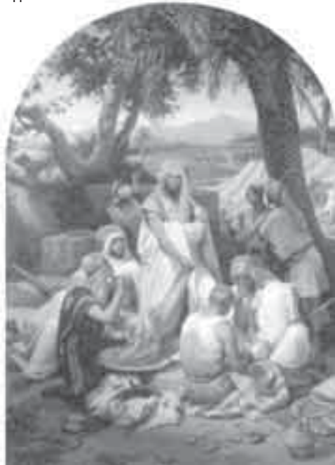
45- فرنيه، ثياب يوسف.