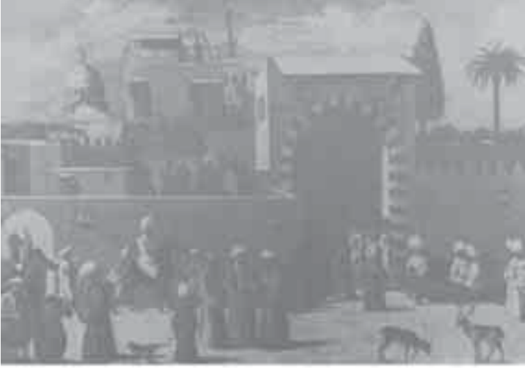
7- مدرسة جنتيلو باليني حفل استقبال سفير البندقية.