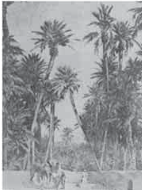
4- فرومنتان, غابة النخيل.