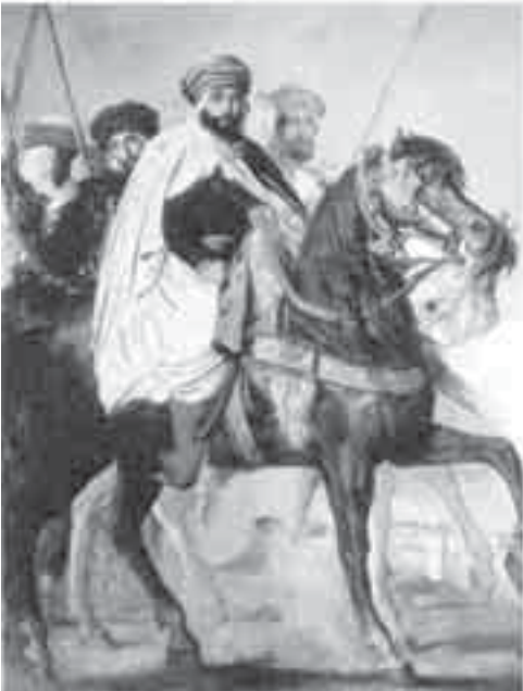
52- شاسريو، خليفة قسطنطينة برفقة حاشيته.