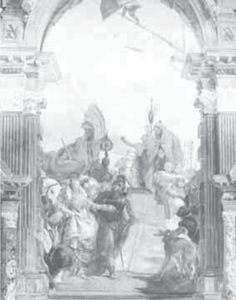
9- تيبولو، لقاء انطونيو وكليوباترة.