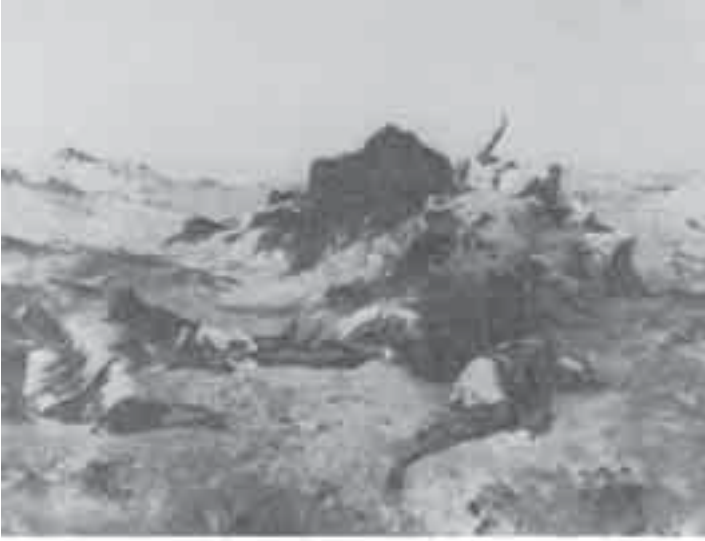
1- فرومنتان، بلاد العطش.