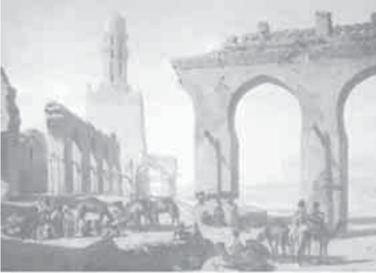
39- ماريلا، خرائب مسجد الحاكم بالقاهرة.