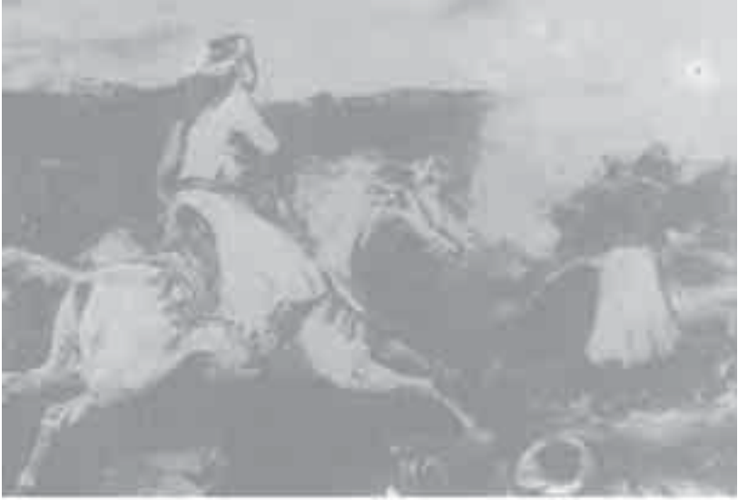
8- ديلاكروا، مشهد من الأتراك واليونانيين.