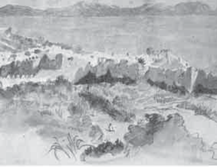
31- ديلاكروا، تخطيطات ورسوم من دفتر المغرب.