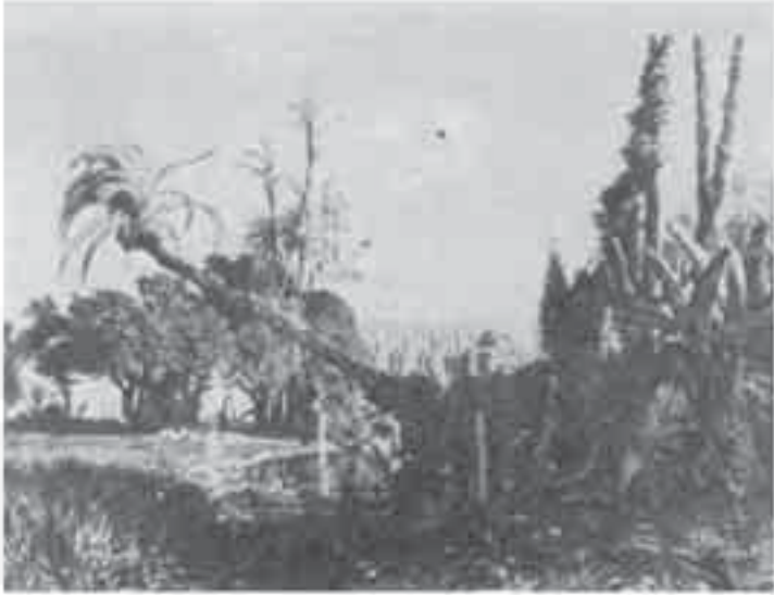
9- ماريلا من ذكريات رشيد.