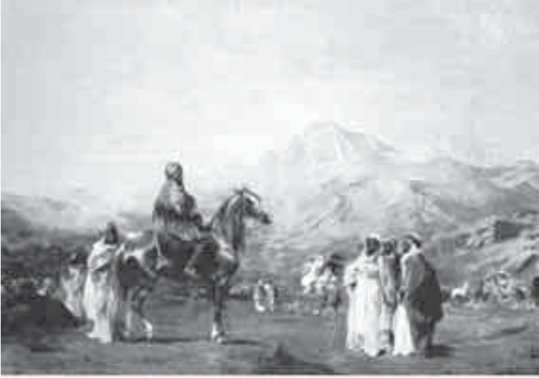
55- فرومنتان, مخيم من جبال الأطلس.