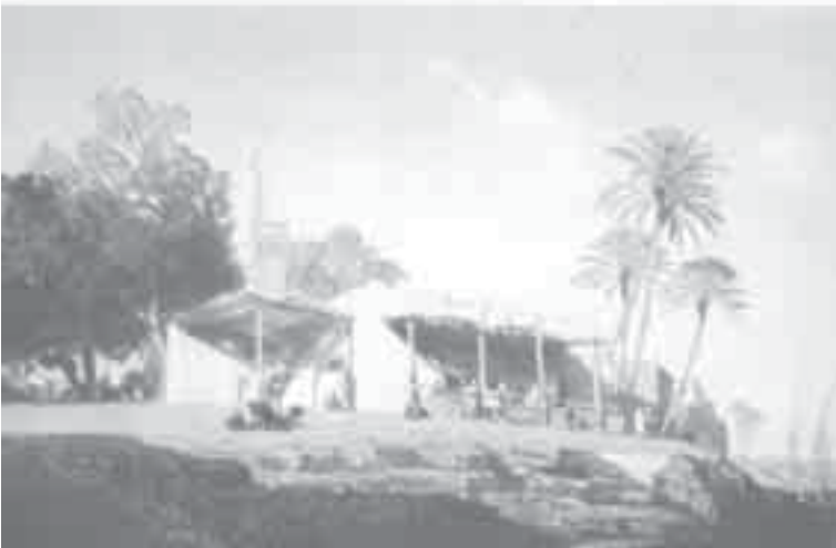
40- ماريلا، بني سويف على النيل.