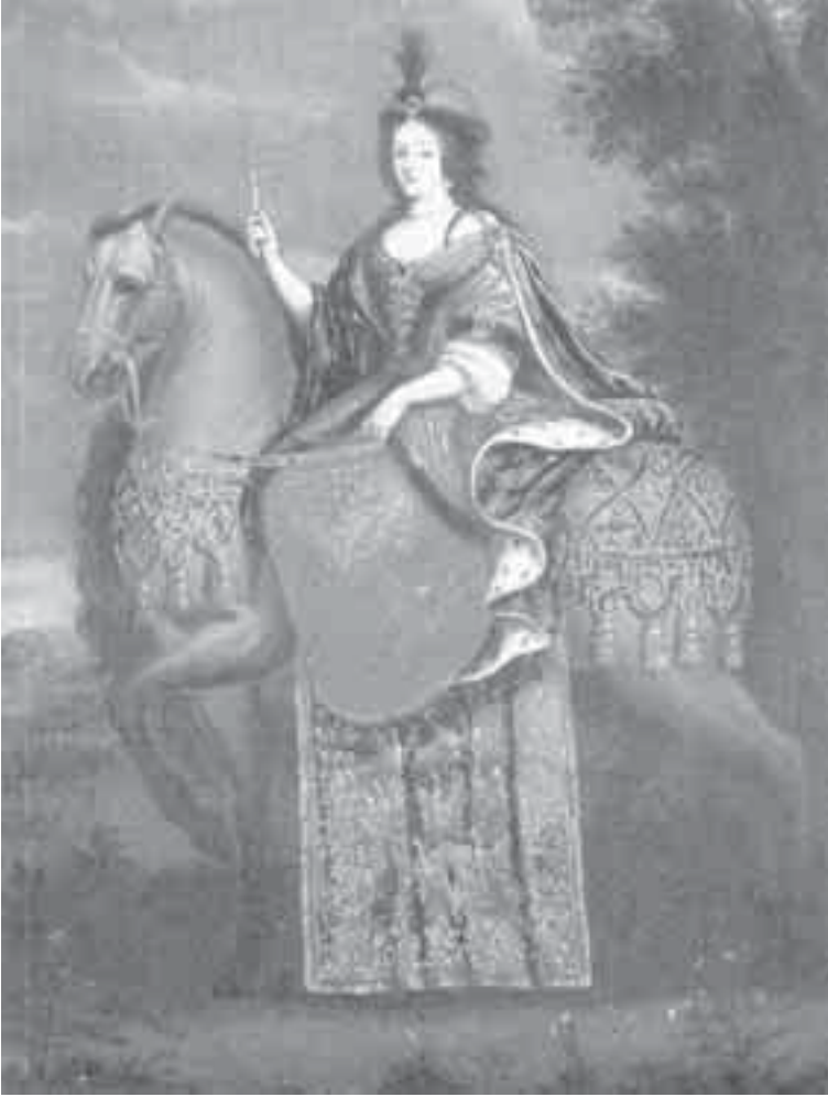
10- سباسكي، الملكة ماريا كازمير.