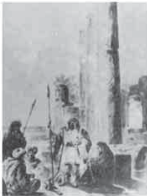
2- فوربان، عرب فوق خرائب عسقلان.