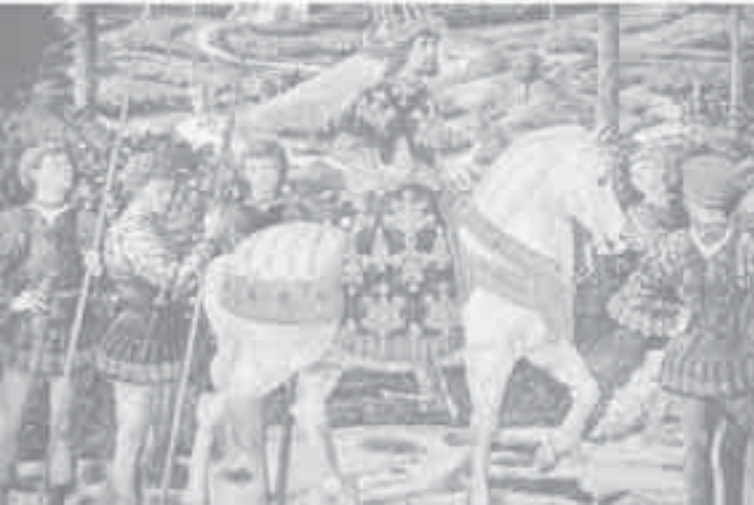
3- غوزولي، مشهد من سجود المجوس.