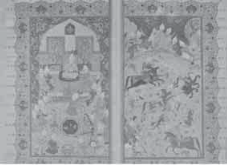
5- منمنمة إسلامية: رقص وغناء وحفل صيد.