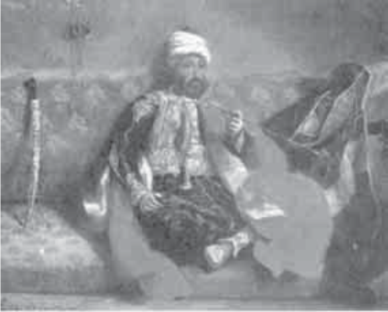
22- ديلاكروا، تركي يجلس على أريكة مع نرجيله.