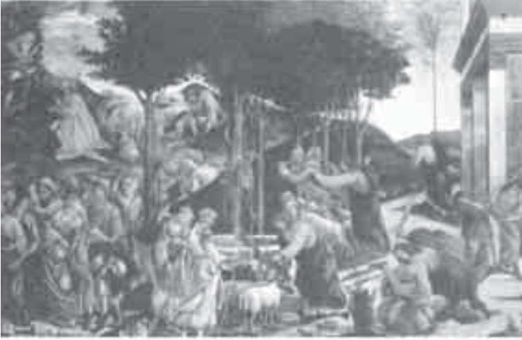
15- بوتشيلي وغيرلاندي، تاريخ موسى.