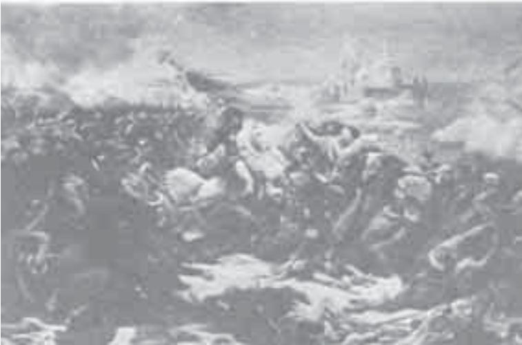
8- غزو، معركة أبو قير.