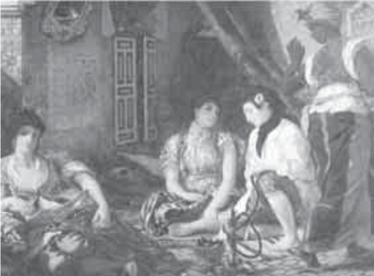
34- ديلاكروا، نساء الجزائر.