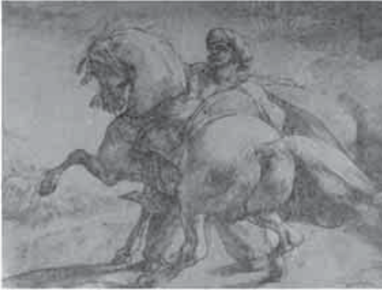
3- جيريكوو، فارس تركي.