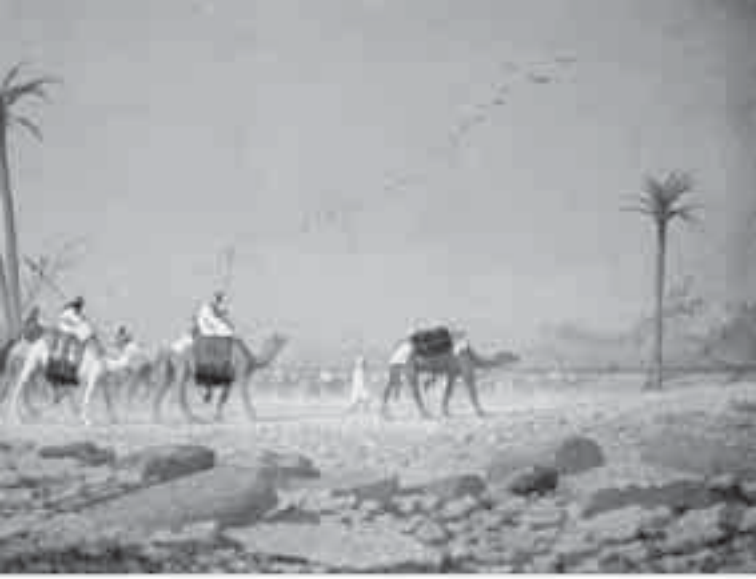
49- فريير، قافلة الصحراء.