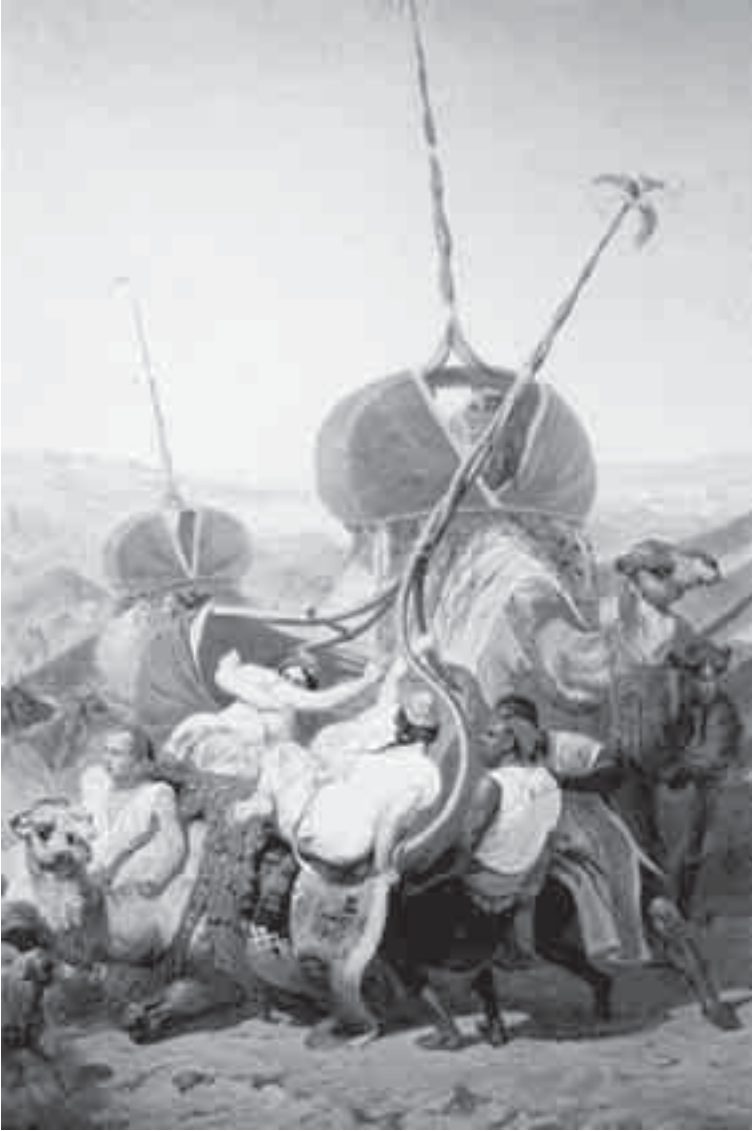
46- فرنیه، الاستیلاء شمالاً عبد القادر.