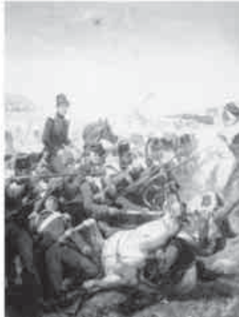
50- فرنیه، معركة سماح.