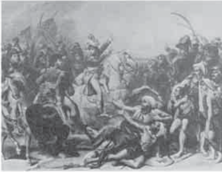
5- غزو، معركة الناصرة.