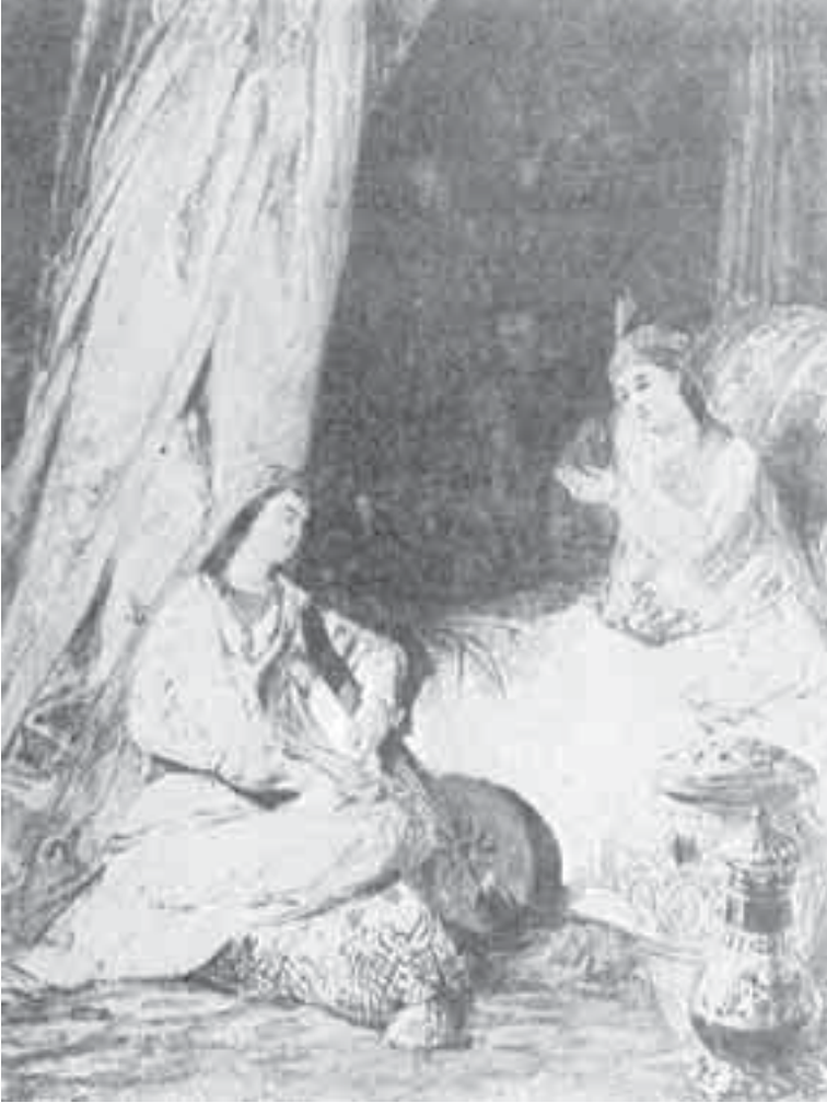
10- بونغتون، مشهد شرقي.