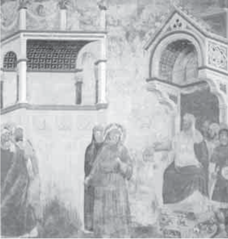
1- غيوتو، الاختبار بالنار أمام السلطان.