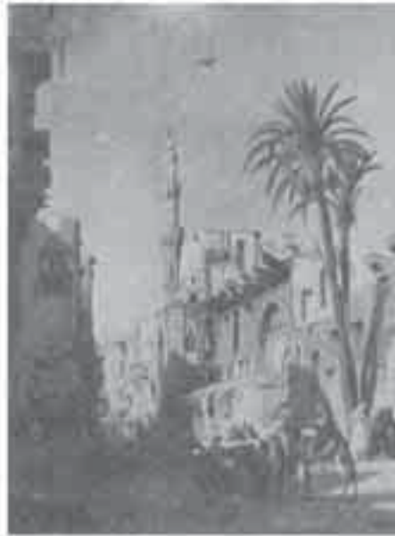
8- ماريلا: شارع في القاهرة.