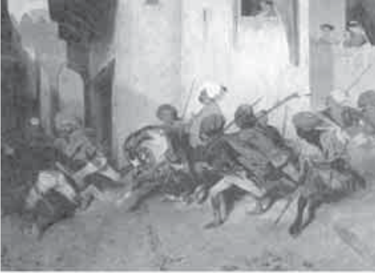
27- ديكان، ديدبان الليل حاجي باي.