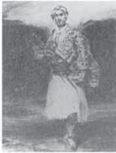
2- ديلاكروا، الكونت بالتيانو.