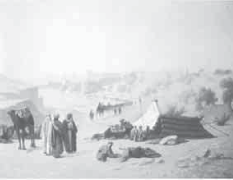
44- فرير، منظر القدس من الشمال.