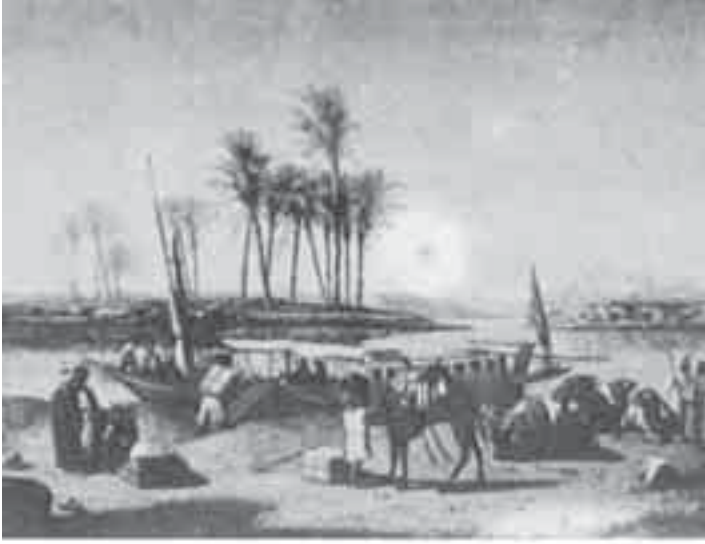
11 - ماريلا: الضفة النيل.