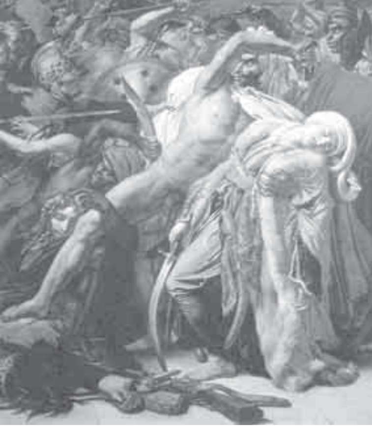
14- جبروديه, انتفاضة القاهرة.