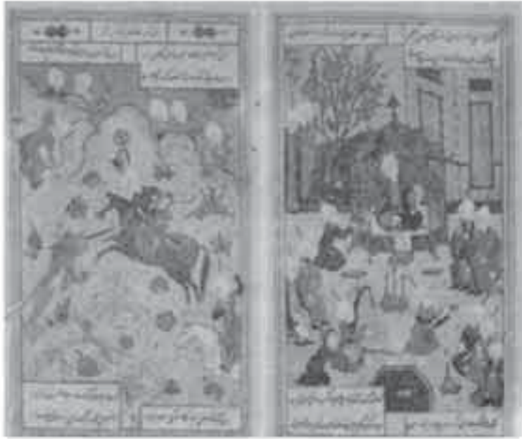
7- ممثلة إسلامية: من ديوان علي شير نوائي.