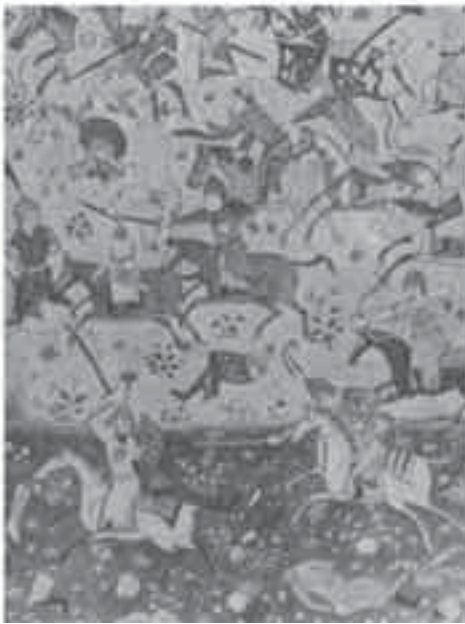
6- منمنمة إسلامية: معركة شاهنامة.