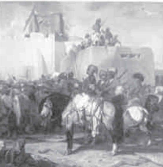
30- ديكان، التعذيب بالخطاطايف.