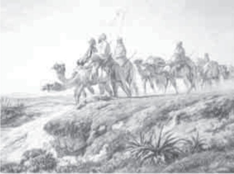
37- ماريلا، قافلة الصحراء.