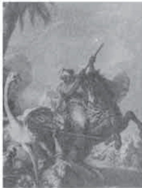
6- فان لو، صيد النعام.