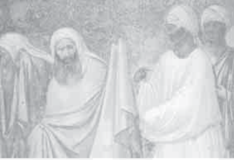
2- غيوتو، جدارية الاختبار بالنار.