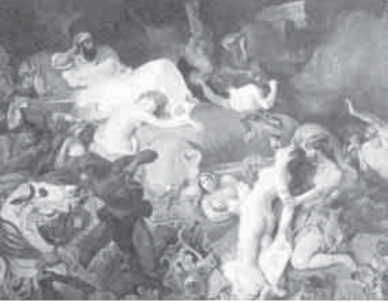
18- ديلاكروا، موت سردانابال.