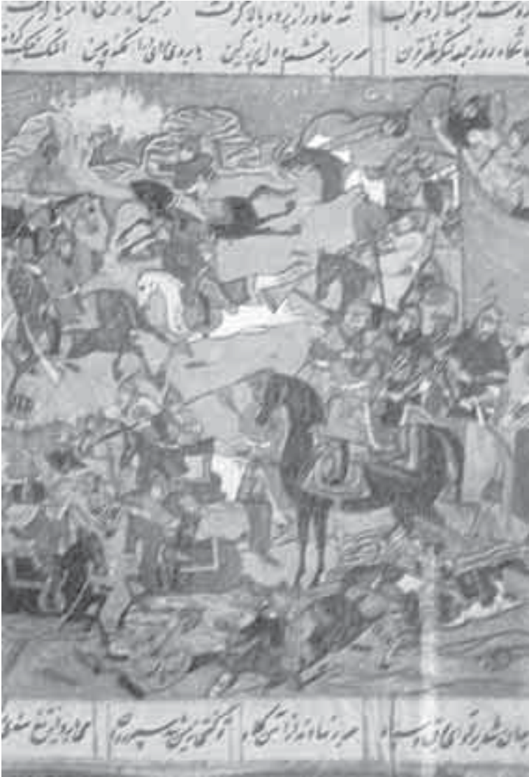
21- منمنمة إسلامية من ظفرنامه.