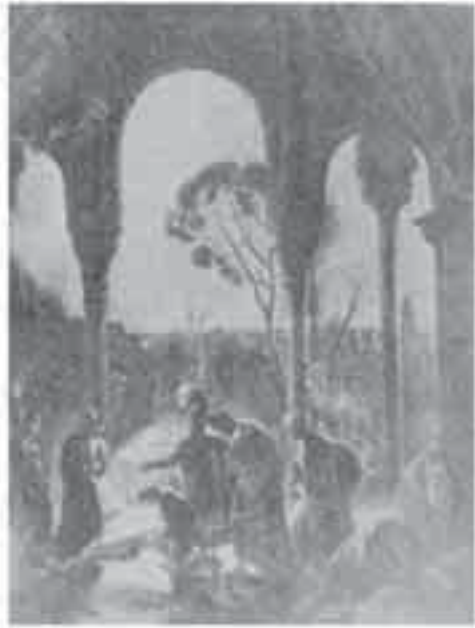
4- فوربان، الاستيلاء على قصر الحمراء في غرناطة.