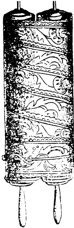
درج الكتاب المقدس

نص مصوّر من دائرة المعارف الكتابية « انظر أيضاً : اقتباسات كتاب الأنجيل من التوراة » [ .