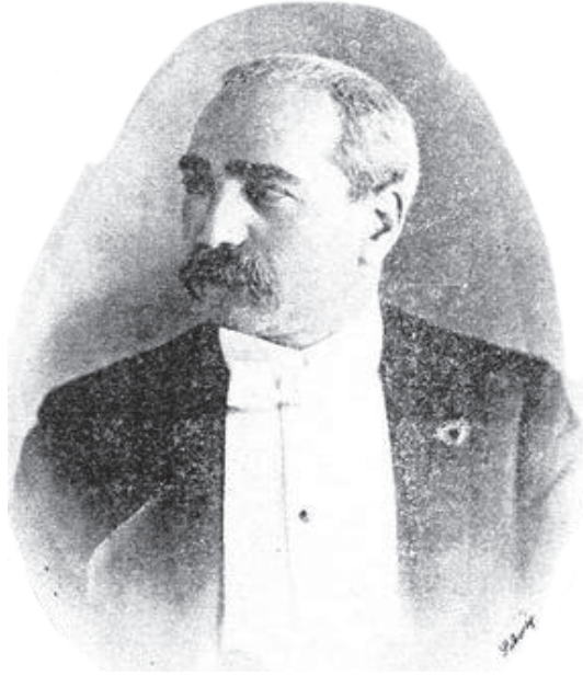
البارون جاك ده منشه.

البارون جاك ده منشه ابن المرحوم البارون بخور ابن المرحوم البارون يعقوب ده منشه، وُلد في مصر في شهر يناير سنة ١٨٥٠. ولما كبر وترعرع دخل المدارس، فأتقن اللغات العربية والفرنسوية والإيطالية والنمسوية والإنكليزية، ولما كان بكر إخوته كان له المنزلة الأولى بينهم، فافتقى خطوات أبيه وجده في الأشغال الخصوصية والأعمال المبرورة.