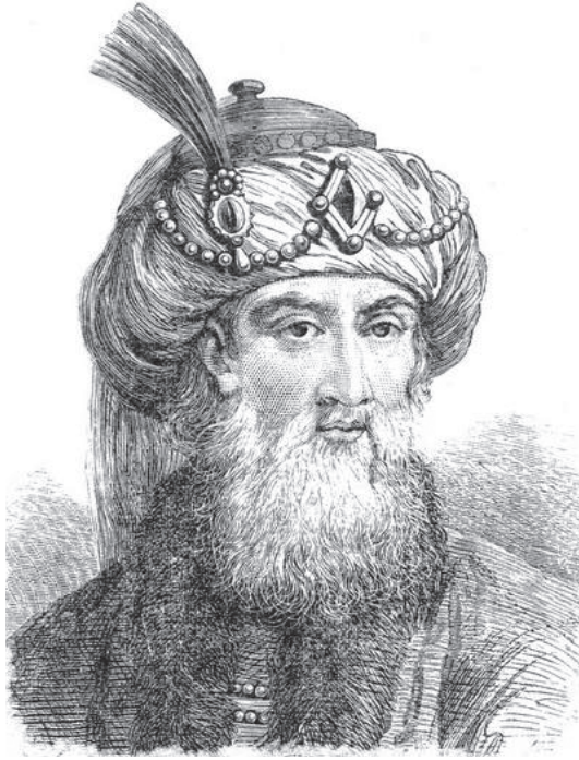
يوسيفوس المؤرخ الشهير.

المؤرخ الذائع الصيت الذي قضى حياته باحثاً ومنقّباً، فاكتشف كثيراً من أسرار التاريخ الغامضة التي كان يعزُّ الوقوف على مبادئها ونتائجها، وهو الذي أتى أعمالاً مجيدة قرنت اسمهُ بالمجد وأذاعت في العالمين شهرته، فكم مرةً خاطر بحياته ذائداً عن حقوق أمته ووطنه، ولا بدُّ من إعلان ذلك تدويناً لذكره، بحيث يرى من ترجمته أنه كان جامعاً بين بلاغة المؤرخ وتضلعه والحاكم العادل والقائد الخبير المُحنك والقاضي المتشرع إلى غير ذلك من الخلال العريضة المنال.