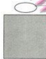
وضعية تواصل سيئة

عندما تحسن من عملية التواصل فإنك تدفع الشخص الآخر للتجاوب معك أكثر، وهكذا يمكنك أن تكون أكثر إقناعاً أيضاً.