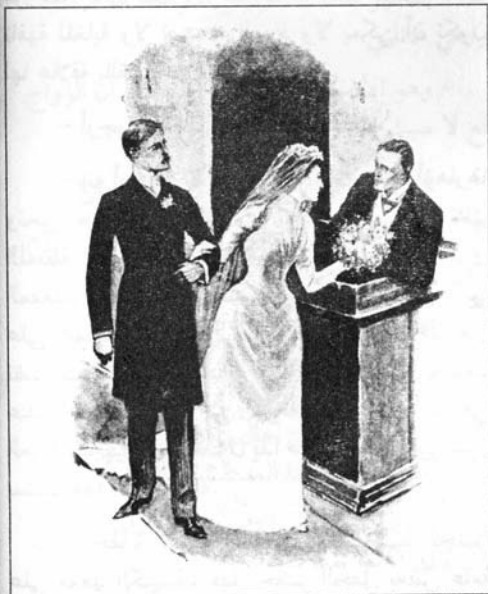
Sydney Paget 1892

- لا؛ إنني أدعوه بالسيد فقط من باب اللباقة،