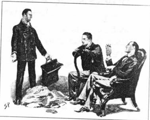
Sydney Paget 1892