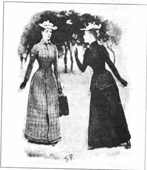
Sydney Paget 1892

لتحدثني ببعض الأمور عن اللورد سايمون، وبدا لي مما سمعته أن لديه أيضاً سرّاً صغيراً قبل الزواج يخفيه، ولكنني تمكّنت من التهرب منها ولحقت بفرانك، فركبنا معاً عربة أجرة وذهبنا إلى مسكن استأجره في ميدان غوردون. وكان ذلك هو زفافي الحقيقي بعد انتظار السنين، فقد كان فرانك مسجوناً