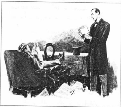
Sydney Paget 1892