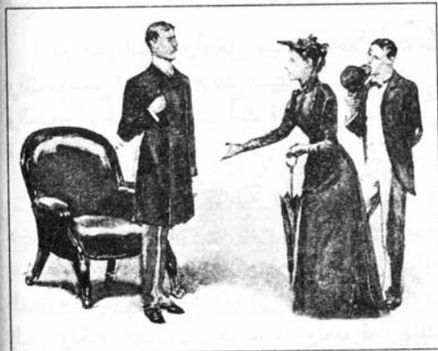
Sydney Paget 1892

- أعرف أنني عاملتك بشكل سيئ وأنه كان من المفروض أن أتحدث إليك قبل مغادرتي، ولكنني كنت مشوّشة الذهن، فمن اللحظة التي رأيت فيها فرانك لم أدرك ما الذي كنت أقوله أو أفعله، حتى