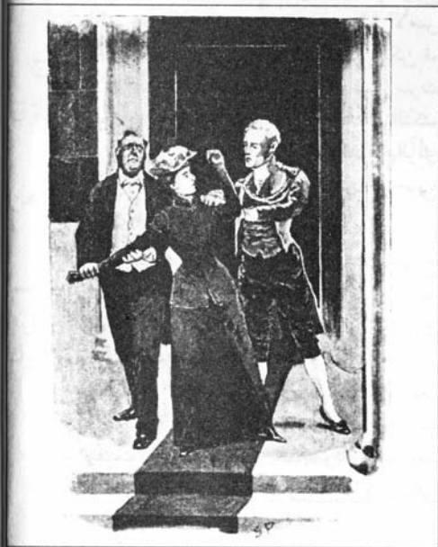
Sydney Paget 1892

في حدوث مشكلة صغيرة حين حاولت اقتحام المنزل بعد العرس مدعية أن لها حقاً عند اللورد سايمون، وقد طردها كبير الخدم والبواب بعد مشهد طويل مؤلم. أما العروس التي كانت -لحسن الحظ- قد