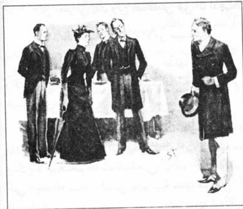
Sydney P. -t 1892

قال هولمز حين انصرف ضيفانا: لقد كانت قضية مثيرة للاهتمام لأنها تُظهر -بوضوح شديد- كيف يمكن أن يكون حل قضية ما في منتهى البساطة بالرغم من أنها قد تبدو للوهلة الأولى غير قابلة للتفسير، فلا شيء يمكن أن يكون أكثر طبيعية من تسلسل الأحداث كما روتها هذه السيدة، ولا شيء