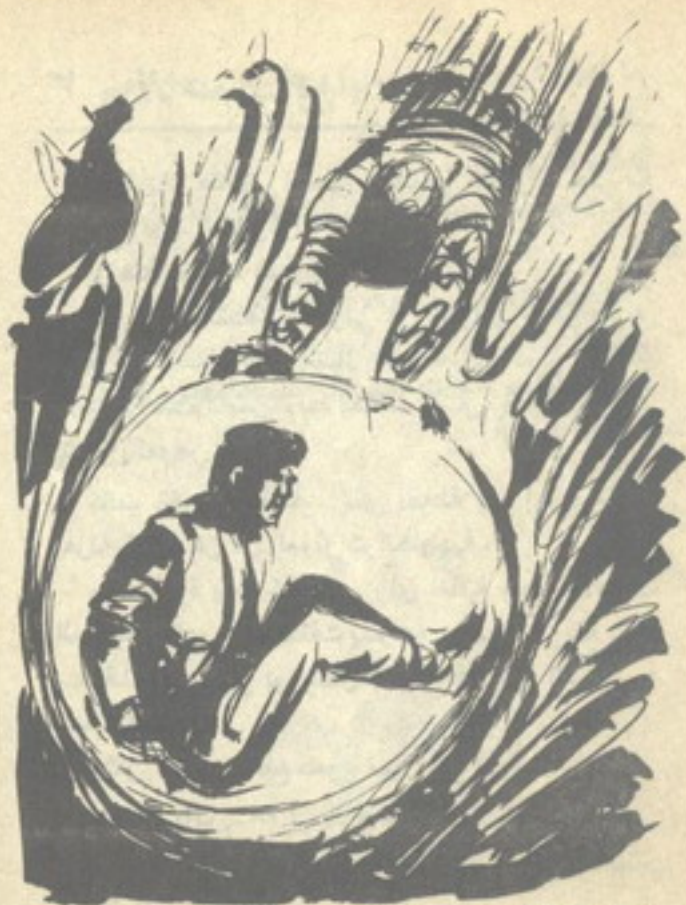
كانت الكرة الشفافة ، التي أحاطه بها (س-١٨) ، تعزله تمامًا عن كل المؤثرات الخارجية ..

- هل .. هل توصلت إليه يا (س-١٨) ؟ لم يجب (س-١٨) .. أو أنه أجاب ، دون أن يصل صوته إلى (نور) ، ولكنه ترك الكرة الشفافة مستقرة على القاع ، واتجه في خطوات سريعة مباشرة إلى نقطة ما ، وانحنى يزيح عنها الرمال في سرعة ، ثم لم يلبث أن التقط جسمًا أسطوانيًا متوسط الحجم ، ثم رفعه أمام وجهه ، واستدار يواجه (نور) ..