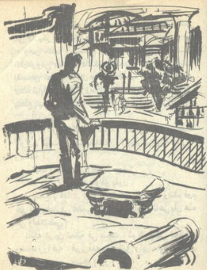
شعر (نور) بمزيج من التوتّر والدهشة ، وهو يقف داخل حجرة واسعة ، خالية إلا من فراش صغير ..

شعر (نور) بمزيج من التوتّر والدهشة ، وهو يقف داخل حجرة واسعة ، خالية إلا من فراش صغير ، ومنضدة مصنوعة من تلك المادة العجيبة ، التي تجمع ما بين الرخام والمخمل ، ويتطلع عبر نافذة زجاجية ضخمة سمكية ، تحتل حائطاً بأكمله تقريباً ، إلى (أطلانتس) ، التي بدت بالنسبة إليه مبهرة ، تفوق ما تخيّلها في حياته كلها ..