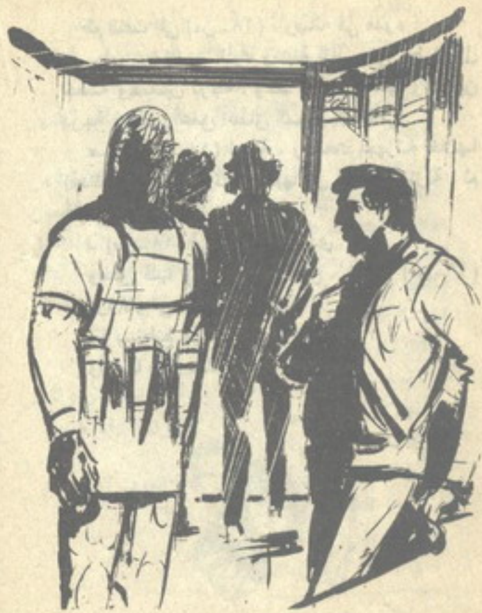
وخفق قلب (نور) في ارتياح ، فطلق (س- ١٨) للعبارة لايمنى سوى أمر واحد ..

ولكن فجأة ، ارتفع أزيز هاتف الفيديو .. في البداية ففكرت في تجاهل الأزيز ، ومغادرة المكتب بسرعة ، إلا أن حسنها الصحفى منعها من ذلك ، وجعلها تلتقط ساعة هاتف الفيديو ، وهي تقول : - (مشيرة محفوظ) ، من جريدة أنباء الفيديو .