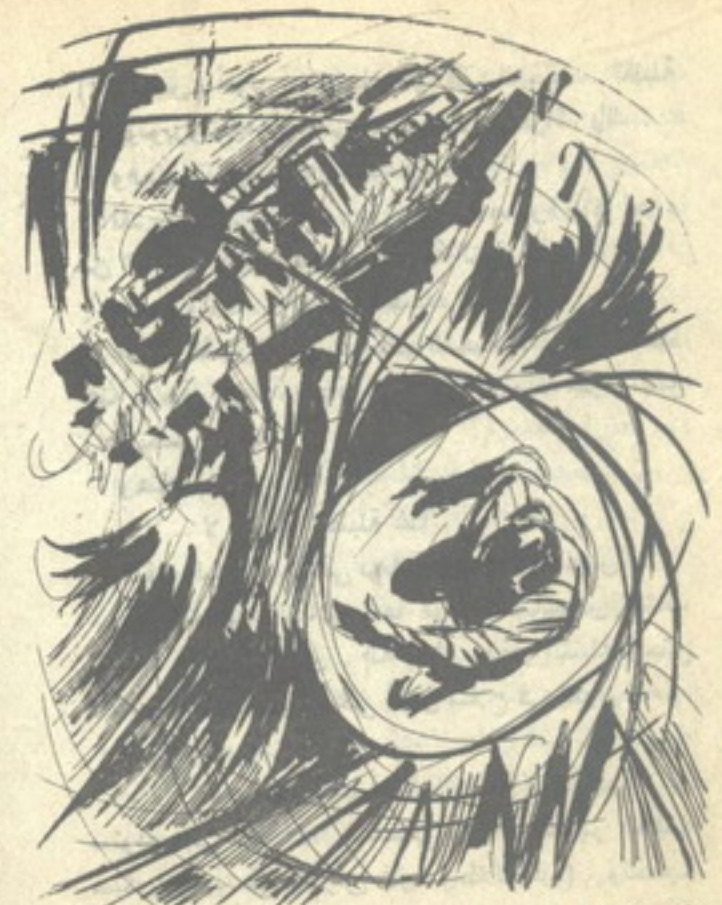
لقد ولت إلى ذهنه ، ودون إنذار ، صورة رأها لجزء من الثانية ، وهو يروى فى دوامة الزمن الرهيبه ..