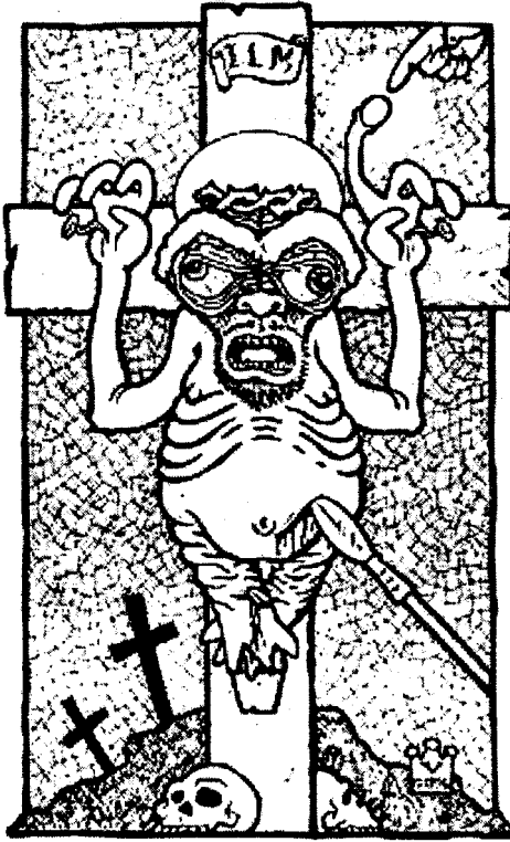
الخروف المصلوب ..!!

الصليب أو خروفا تحت أقدام الصليب أو خروفا على الصليب . وأحيانا يكون الخروف برأس آدمى ..!! وفى نهاية القرن الثامن أمر البابا هادريان الأول فى مجمع اسطنبول السادس بأن يحل رجل محل الخروف على الصليب ..!! ثمانية قرون مضت على المسيحية قبل أن تعرف المخلص يسوع على الصليب فى لوحاتها المقدسة بدلا من الخروف ..!! فإن كان يسوع قد صلب حقا فلماذا رسموا بدلا منه خروفا لمدة ثمانية قرون كاملة ..!!؟ فى ضوء التاريخ الصحيح وأسباب الأحداث وعلى لوحة الخروف المصلوب لمدة ثمانى قرون لماذا يعتقدون فى قضية الصلب وأنها من مسلمات العقيدة ..!!؟