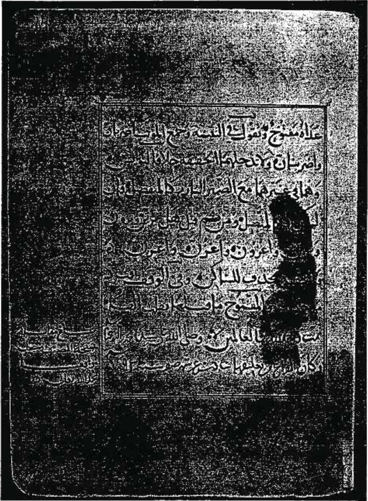
الصفحة الأخيرة من الكافية . جامعة برينستون