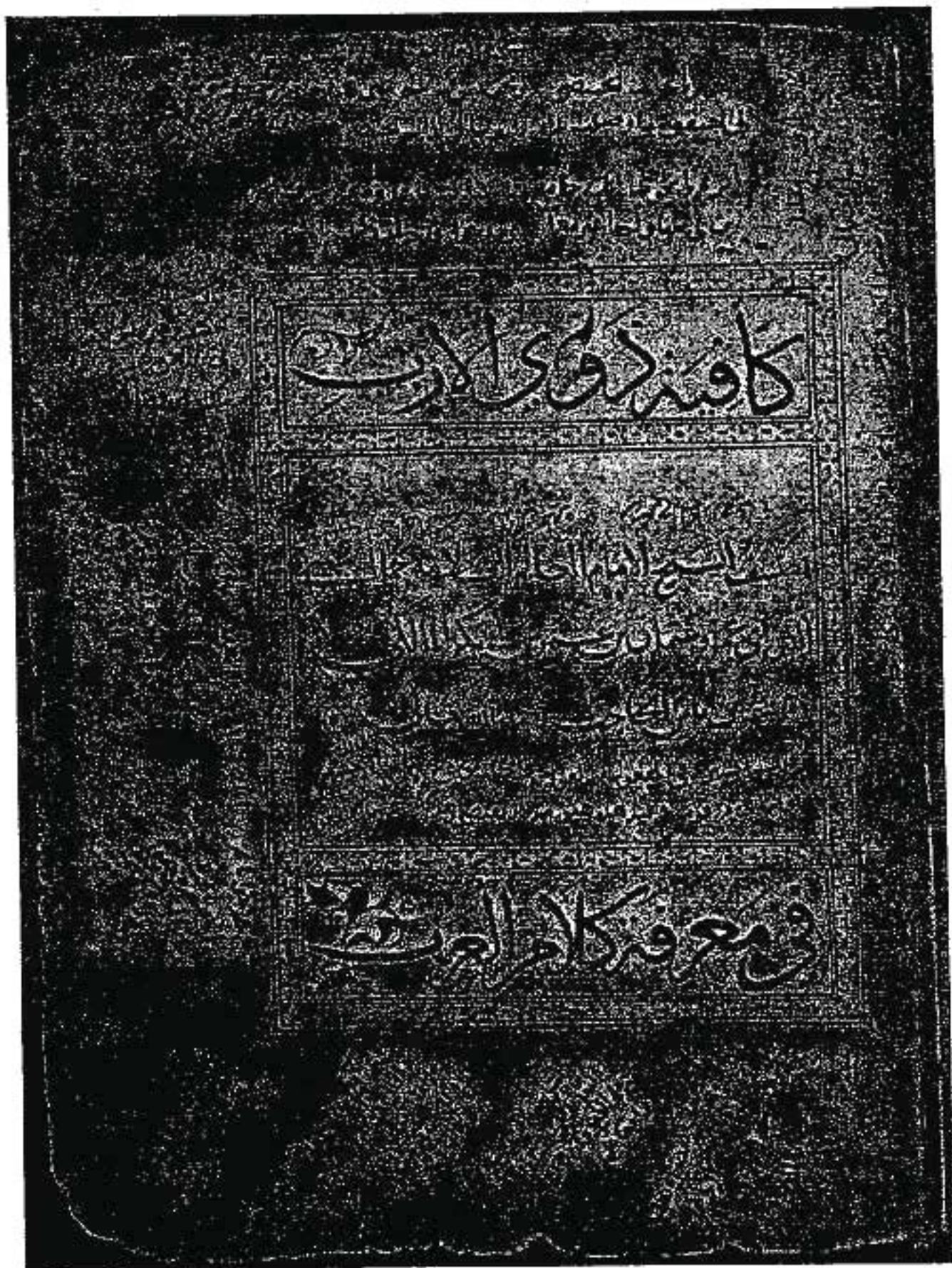
الصفحة الأولى من الكافية - جامعة برينستون