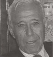
طه عبد الرحمن