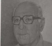
زكي نجيب محمود