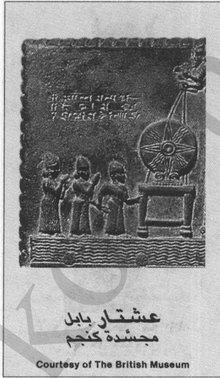
عشتار بابل مجسّده كنجم

هل تعرفون الإلهة المصوّرة على غلاف هذه المجلة؟ انها إيزيس، الام الإلهة القديمة لمصر. فإذا زرتم متحفا او تصفّحتم كتابا عن التاريخ القديم، رأيتم على الأرجح اصناما مماثلة كهذا. ولكن تأملوا في ذلك: هل تسجدون وتعبدون الإلهة إيزيس؟