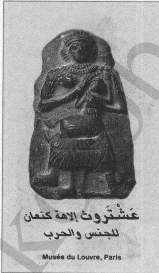
عَشْتَرُوثُ إلهة كنعان للجنس والحرب

عبادة الام الإلاهة لا تزال تمارَس كانت خلال ايام المسيحيين الاولين. واختبر الرسول بولس ذلك في افسس في آسيا الصغرى. فكما في اثينا، مدينة اخرى تعبد الإلاهات، شهد لِد «الاله الذي خلق العالم،» الخالق الحي، الذي لا يشبه ذهباً او فضة او حجر نقش صناعة واخترع انسان، كان ذلك اكثر مما يمكن ان يحتمله الافسسيون، الذين كان معظمهم يعبدون الام الإلاهة أرطاميس. وأولئك الذين كسبوا رزقهم بصياغة هياكل فضية للإلاهة اثاروا شغبا، ونحو مدة ساعتين، صرخ الجمع: «عظيمة هي أرطاميس الافسسيين.» — اعمال ١٧: ٢٤، ٢٩؛ ١٩: ٢٦، ٣٤.