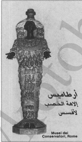
أرطاميس إلاهة الخصب لافسس

ان هذه الآثار متعددة ومفضّلة اكثر من ان تحصل على نحو عرضي. فالتشابه بين تماثيل الام والولد لمريم العذراء وتماثيل الإلاهات الوثنية، مثل