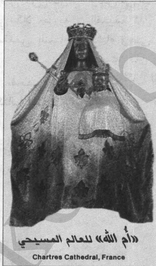
«أم الله» للعالم المسيحي

إيزيس، لا يمكن ان يمضي دون ان تجري ملاحظته. ومئات التماثيل والايقونات للسيدة السوداء في الكنائس الكاثوليكية في كل مكان من العالم لا يمكن ان تفشل في التذكير بتمثال أرتاميس. والعمل (Théo—Nouvelle encyclopédie catholique) يقول عن هذه العذراء السود: «يبدو انها كانت وسيلة لنقل ما تبقى من التعبّد الشعبي لديانا [أرتاميس]... او سيبيل الى مريم.» ومواكب يوم انتقال مريم العذراء تجد ايضا نموذجها الاصلي في المواكب اكراما لسيبيل وأرتاميس.