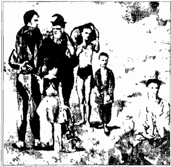
تالیر سگامو السهلوانسون (Saltimbanques)