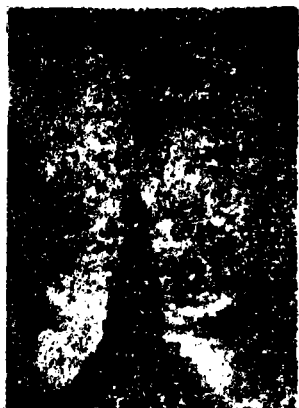
تورم مع ثخانة فى الأطراف السفلى نتيجة الزهري ( السفلس )