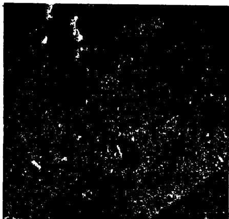
تآكل العظام من أعراض السفلس فى الدور الثالث