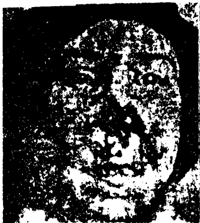
تخريب صمغى متسع فى الوجه « السفلس : الدور الثالث »