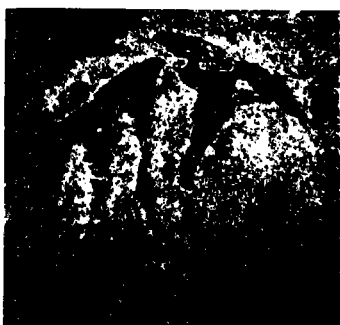
تخريب صمغى فى اللسان « لاحظ التآكل الظاهر حتى ليكاد اللسان يقطع شطرين »

هذه الصور منقولة عن كتاب « الزنى » للدكتور الأخ الفاضل نبيل الطويل