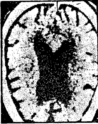
● خلايا المخ بعد ٤ سنوات من الادمان

أعلن الدكتور « هولجر التينكريش » استشاري الامراض العصبية في برلين الغربية ، ان تعاطي المواد المخدرة عن طريق الشم والتي يطلق عليها « السموم البيضاء » لا يقتصر تأثيره الضار على انشطة الكبد والكلي فقط . . وانما يؤدي الى اضطراب الجهاز العصبي . . ومع الوقت يفقد المدمن قدراته الذهنية وادراكه السليم .