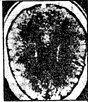
● خلايا المخ قبل الادمان

وأكد ان الادمان يؤدي الى تدمير اجزاء من المخ فيحدث ثقبواً فعلية في انسجة المخ . . وأضاف أن ادمان السموم البيضاء يكون دائماً ادماناً عضوياً وليس ادماناً نفسياً كما يحدث في بقية أنواع المخدرات . . وينتج عن هذا الادمان تسمم اجهزة الجسم وفقدان القدرة على الكلام والغيبوبة والاحباطات والتغييرات