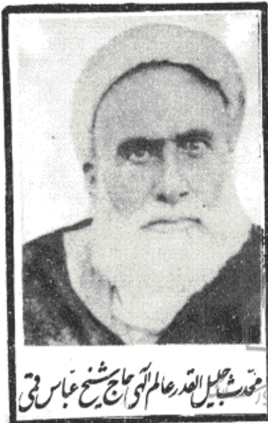
محدث خلیل القدر عالم الہی حاج شیخ عباس قمی