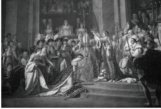
حفلة زواج نابوليون وجوزفين.

وكان نابوليون يزور الأصدقاء والأصدقاء مع خطيبته، وقيل إن جوزفين أظهرت شيئاً من التردد بعد الخطبة، بدليل أنها كانت يوماً مع نابوليون مارةً أمام منزل مُستشارها الموسيو راجيدو أحد موثقي العقود، فدخلت منزله وسألت خطيبها أن يبقى خارج غرفة هذا الرجل، ولما خلت به استشارته لآخر مرة في مسألة اقترانها بنابوليون، فقال لها: «ماذا تفعلين؟ أتقترنين بجنرال لا يملك إلا السيف والعباءة العسكرية ... بجنرال صغير ليس له اسم ولا مُستقبل ... بجنرال هو دون سائر قواد الجمهورية! إنه لخير لك أن تتزوجي أحد المتعهدين بتقديم البضائع والحاجيات من أن تعقدي مثل هذا القران.»